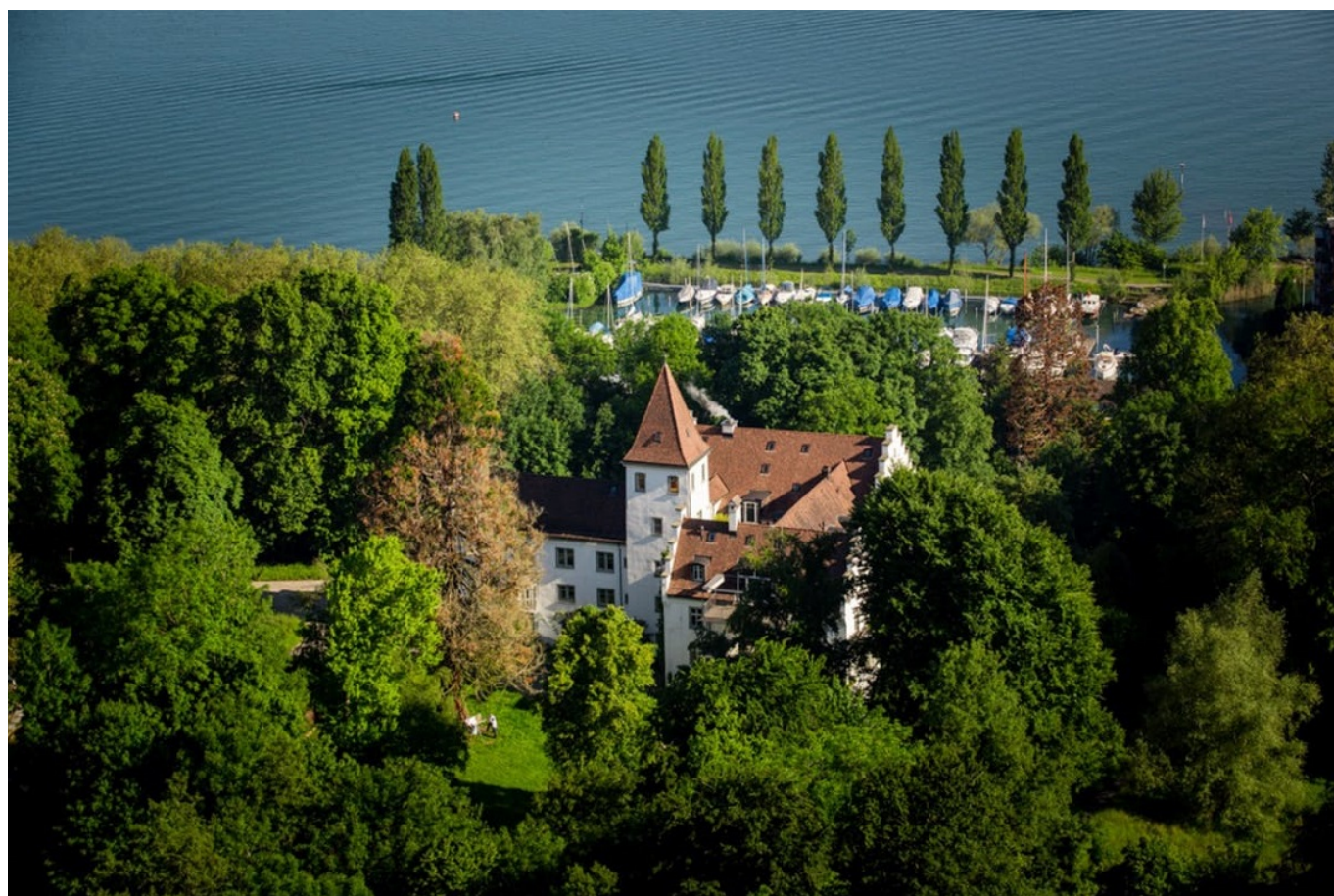
Замок Вартегг.