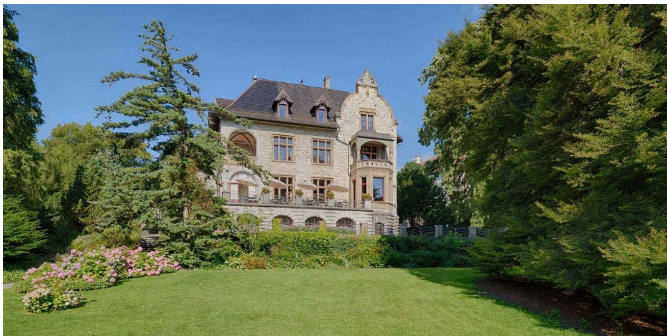
Вилла Boveri.

На пятом месте – атмосферная вилла Boveri в Бадене. Она была построена в конце XIX века для семьи одного из основателей концерна ABB Вальтера Бовери и сейчас охраняется как памятник старины. Парк открыт ежедневно до 9 вечера, а по залам поместья по запросу проводят экскурсии. Здесь регулярно проходят выставки, концерты и лекции. В исторических интерьерах можно организовать и деловую встречу.