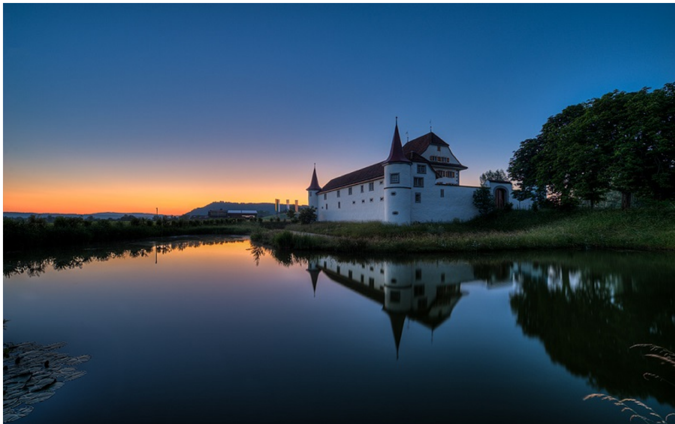
Замок Вихер.

Оригинальным местом для проведения торжественной церемонии для тех, кому наскучили истории про замки, рыцарей и прекрасных дам, может стать галерея Trinkhalle в Интерлакене. Подобные галереи возникли во многих европейских курортных городах в середине XIX века, когда у аристократов вошло в моду ездить «на воды»: наверное, примерно в таком месте лечила разбитое сердце Китти Щербацкая.