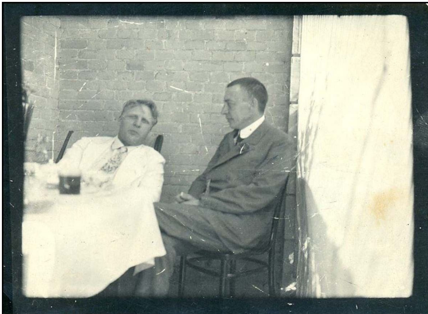
Ф. И. Шаляпин на даче у С. В. Рахманинова

Сергей Васильевич очень любил Швейцарию и в конце двадцатых годов задумал приобрести там дом, что и было осуществлено в начале тридцатых годов. Недалеко от Люцерна Рахманинов выстроил виллу, назвав ее «Сенар» ( по начальным буквам своего имени и имени жены, с прибавлением в конце начальной буквы своей фамилии). Он очень ее любил, нравилось бывать там и Шаляпину, который стал достаточно частым гостем у Рахманиновых. (О жизни С. В. Рахманинова Наша Газета уже рассказывала .)