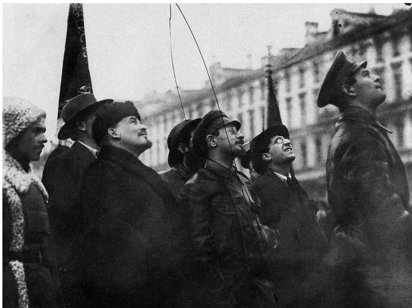
В. И. Ленин, Я. М. Свердлов, В. А. Аванесов на открытии временного памятника К. Марксу. Москва, 7 ноября 1918 г.

Революционеры делали выбор в пользу практичных вещей из носких и немарких материалов: особенно им полюбилась кожа. Не зря в своих воспоминаниях Лев Троцкий писал, что враги называли коммунистов «кожаными»: «Думаю, что во введении кожаной «формы» большую роль сыграл пример Свердлова. Сам он, во всяком случае, ходил в коже с ног до головы, т.е. от сапог до кожаной фуражки. От него, как от центральной организационной фигуры, эта одежда, отвечавшая характеру того времени, широко распространилась. Товарищи, знавшие Свердлова по подполью, помнят его другим. Но в моей памяти фигура Свердлова осталась в облачении черной кожаной брони – под ударами первых лет гражданской войны».