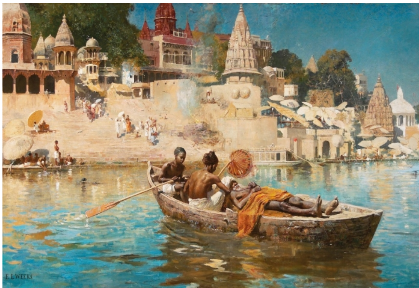
Эдвин Лорд Виз «Последнее путешествие», 1885 (masilugano.ch)

Автор: Лейла Бабаева, Лугано, 27. 10. 2017.