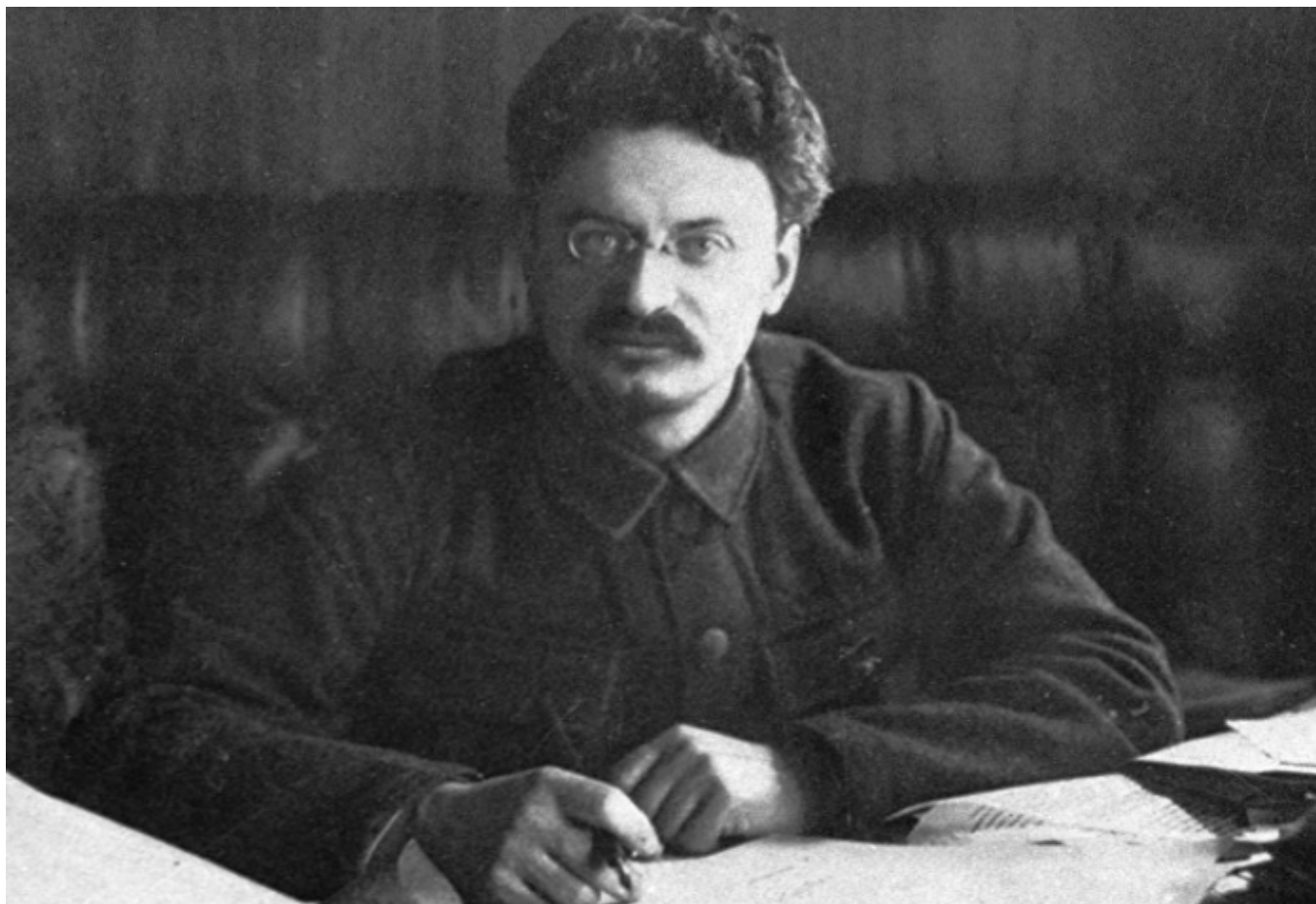
Лев Давидович Троцкий (1879-1940)