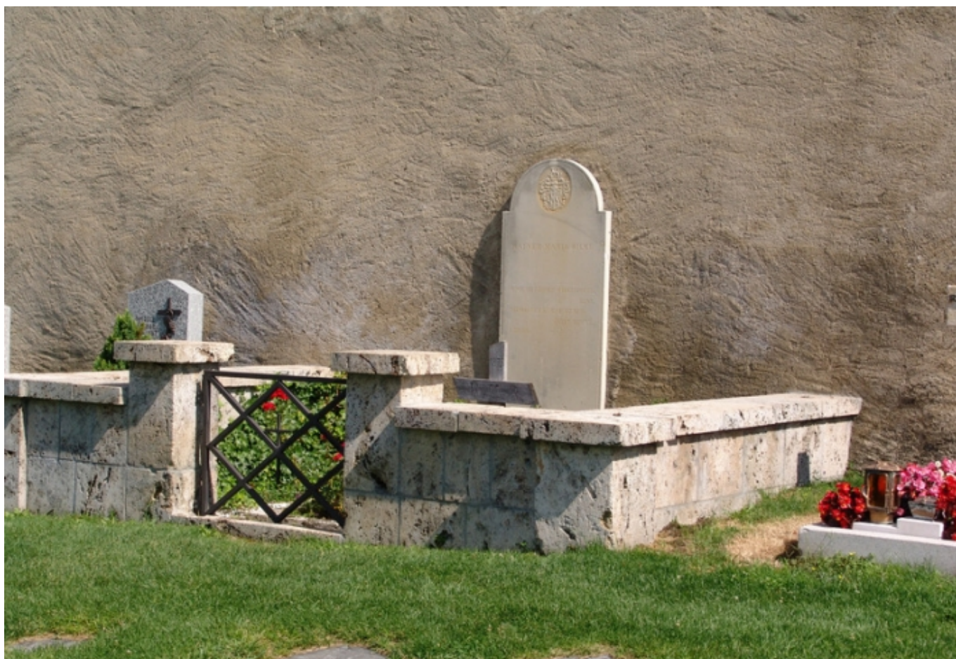
Могила Рильке у церкви св. Михаила над Рароном

Автор: Анастасия Александрова , Цюрих-Берн, 18. 09. 2017.