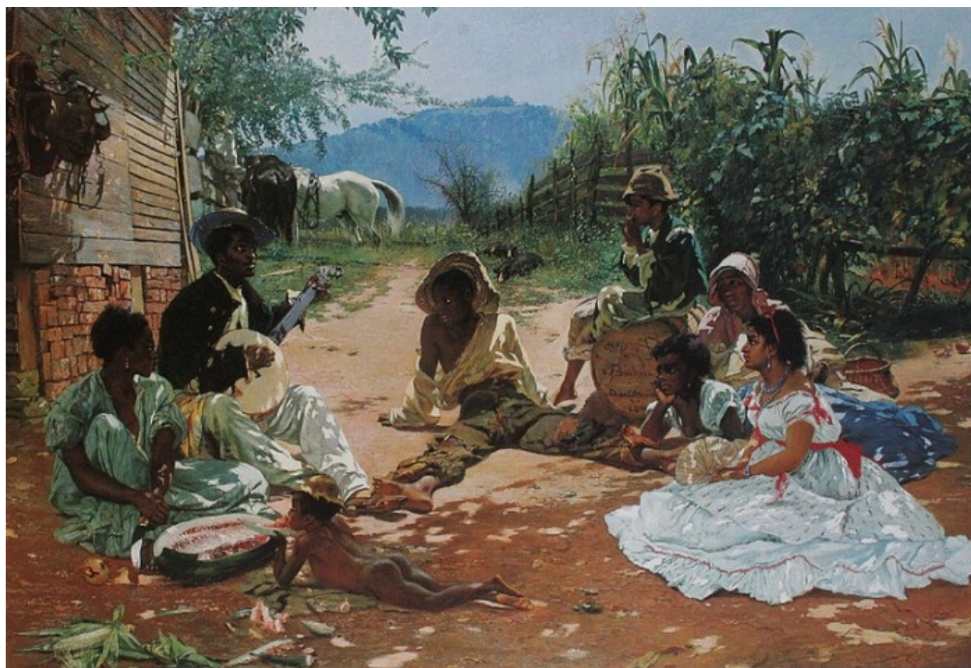
Франк Буксер: «Песня Мери Блейн», 1870, Kunsthau Zürich (Википедия)

Автор: Лейла Бабаева, Вашингтон-Золотурн, 22. 08. 2017.