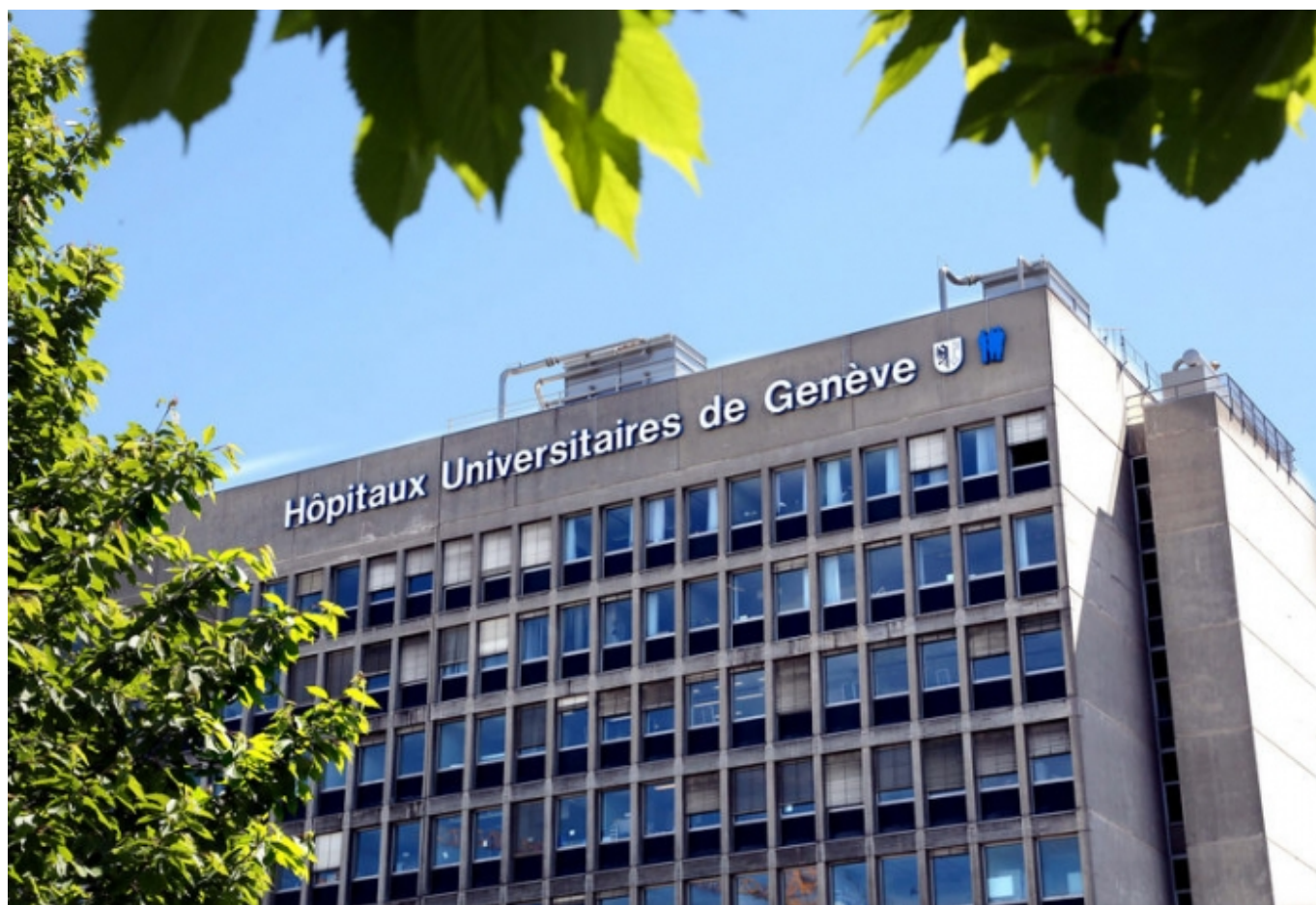
Университетский госпиталь Женева