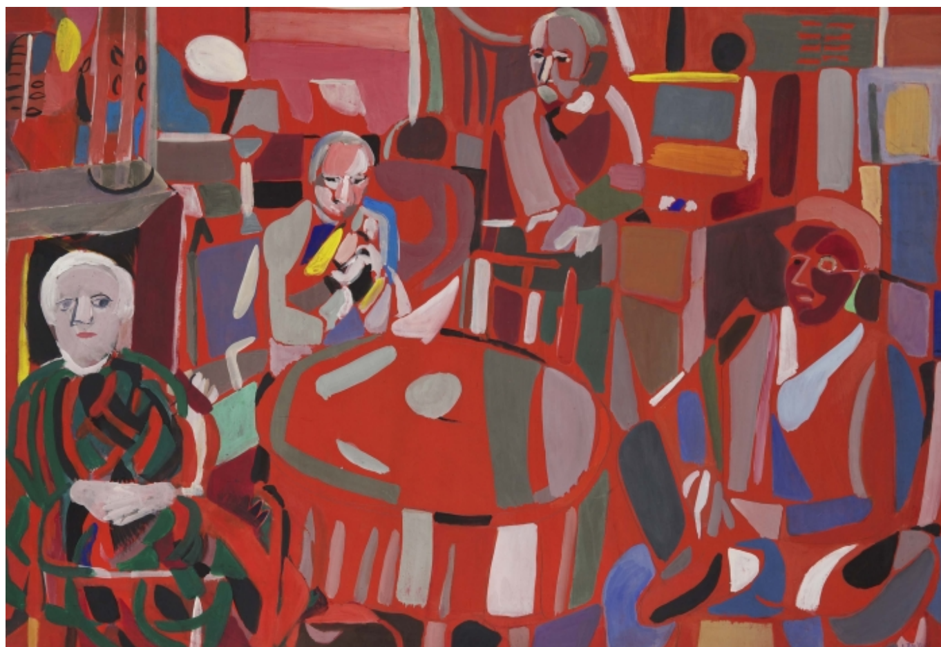
Андрей Ланской (1902-1976). "Без названия", около 1930 г. Гуашь, бумага, 73 x 100 см