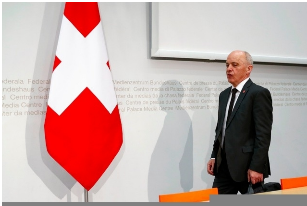
Отказ от RIE III в прессе называют "пощечиной Маурера"

Предложив населению реформу, «якобы разработанную для небольших местных компаний, в то время как на самом деле она оказалась выгодной самым крупным», правые ошиблись, считает La Liberté. Bund и TagesAnzeiger называют провал «персональным Ватерлоо» министра финансов Ули Маурера, члена Народной партии Швейцарии, которому теперь придется разрабатывать новую реформу, RIE IV, опираясь – как вариант – на план «В», разработанный некоей ... Эвелин Видмер-Шлумпф (предшественницей Ули Маурера на этот посту).