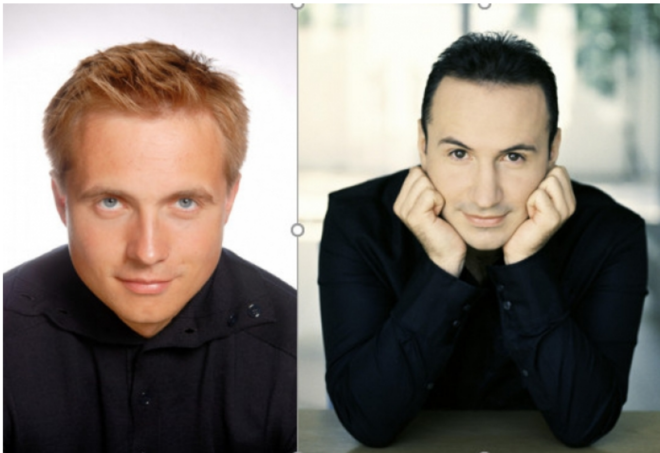
Василий Петренко и Симон Трпчески