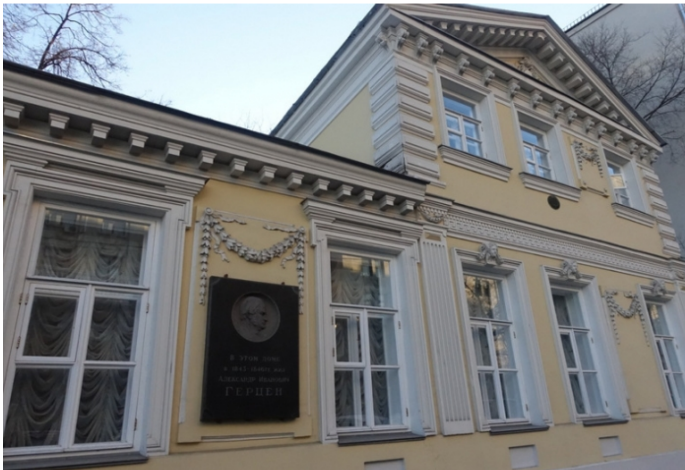
Дом-музей А. И. Герцена в Москве (с) Nashagazeta.ch

Автор: Тамара Приходько, Москва, 4. 01. 2017.