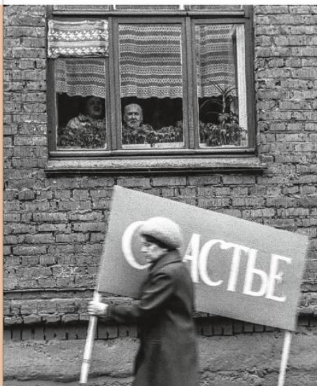
L'UTOPIE AU QUOTIDIEN OBJETS SOVIÉTIQUES 1953-1991 09.12.2016 - 30.04.2017