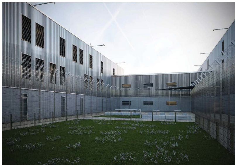
Двор для прогулок (ge.ch)

для получивших короткие сроки менее 18 месяцев и 150 – для лиц, отбывающих длительные сроки лишения свободы.