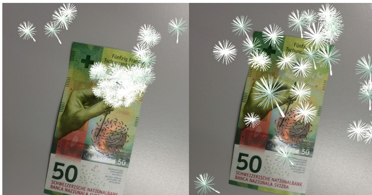
Новые 50 франков в дополненной реальности от SNB