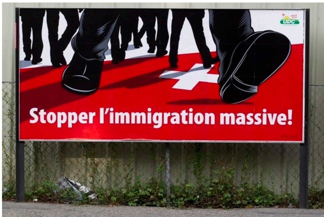
Плакаты, посвященные инициативе НПС об ограничении иммиграции, за которую швейцарцы проголосовали в 2014 году