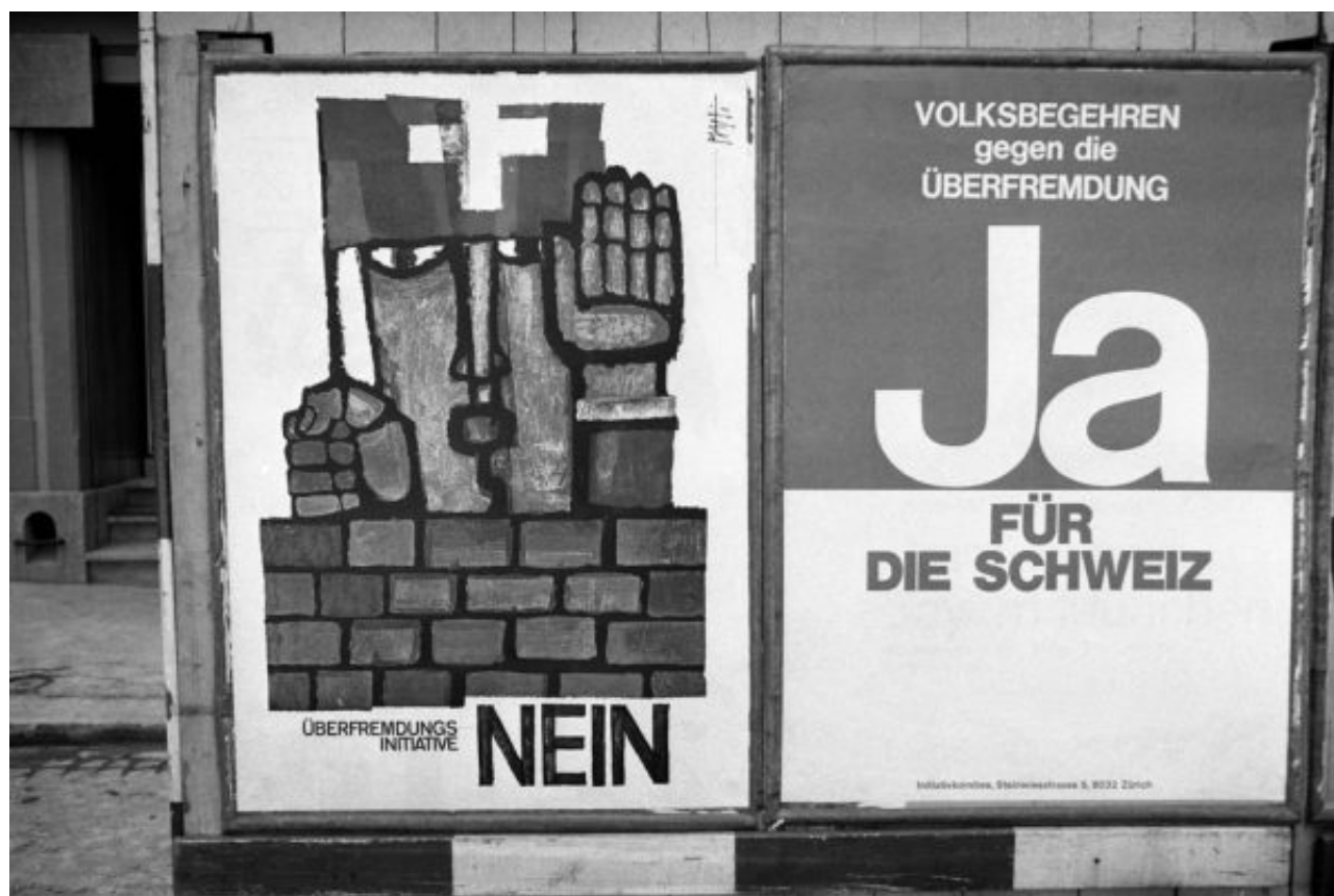
Плакаты, посвященные "инициативе Шварценбаха" об ограничении иммиграции, которую швейцарцы отвергли в 1974 году 66% голосов

Сегодня собрать необходимое количество голосов для того, чтобы вынести вопрос на референдум, намного проще: требующиеся 100 тысяч подписей инициаторам обеспечивают лишь 1,9% населения, имеющего право голоса, в то время как в 1891 году нужно было заручиться предварительным согласием 7,6%. Растущее недовольство действующей политикой привело к тому, что, начиная с 1970-х годов, левые и правые протестные движения все чаще используют этот инструмент для выражения своего недоверия курсу властей, поддерживаемому большинством.