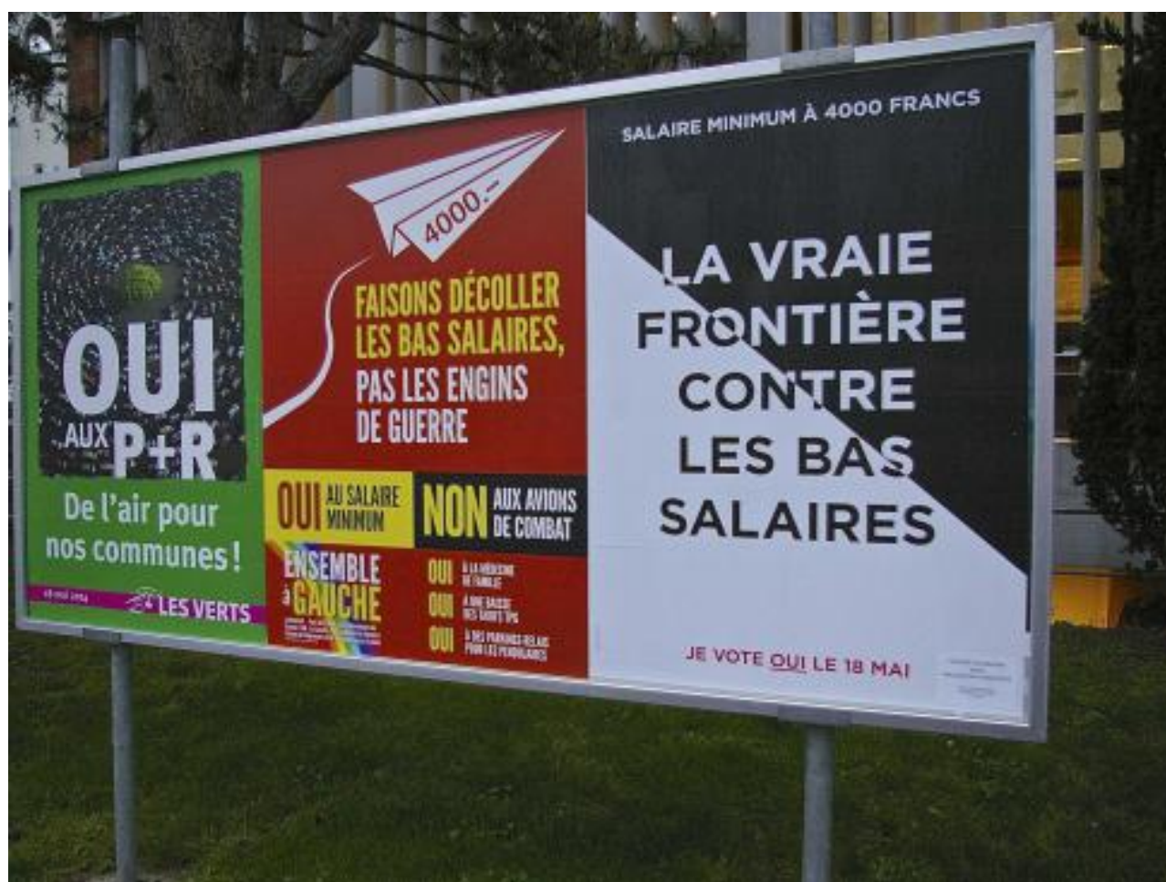
Плакаты, посвященные инициативе об установлении минимальной зарплаты в размере 4000 франков

Поддержку этому правительственному проекту выразили 183 тысячи проголосовавших (при 120,6 тысячах «против») и 16 кантонов и 4 полукантона (3 кантона и 2 полукантона выступили против него). В результате уже 21 июля Федеральный совет подготовил новые статьи в Конституцию, определяющие порядок действия народной инициативы. Примечательно, что, по свидетельствам газеты NZZ, прокомментировавшей результаты голосования несколько дней спустя, швейцарцев не слишком воодушевила представившаяся им возможность определять политический курс страны – явка на участках в тот исторический день едва превысила 49%. «Подобное безразличие к инструменту, который, тем не менее, может глубоко изменить политическую и юридическую жизнь Швейцарии, никогда еще не наблюдалось», – писала газета.