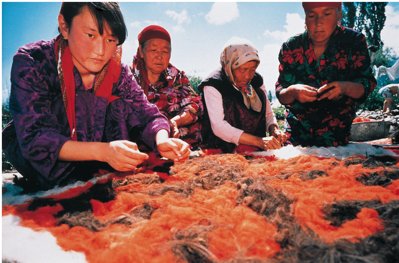
Киргизия

В ходе дебатов о необходимости участия Швейцарии в оказании помощи развивающимся странам некоторые политики высказывали сомнения в ее эффективности. Так, представитель Народной партии Швейцарии Роджер Кеппель считает, что эти расходы не оправданы. «Тысячи африканских мигрантов, прибывающих каждый день, свидетельствуют о провале ОПР. Нужно набраться смелости и оставить Африку развиваться самостоятельно», – заявил он. Каждый раз при рассмотрении бюджета в парламенте начинаются бурные дебаты на тему способов распределения средств и осуществления контроля над финансированием, отмечает швейцарская пресса. Впрочем, в этот раз депутаты Национального совета не поддержали предложение своих коллег из Народной и Христианско-демократической партий о возвращении проекта правительству на доработку.