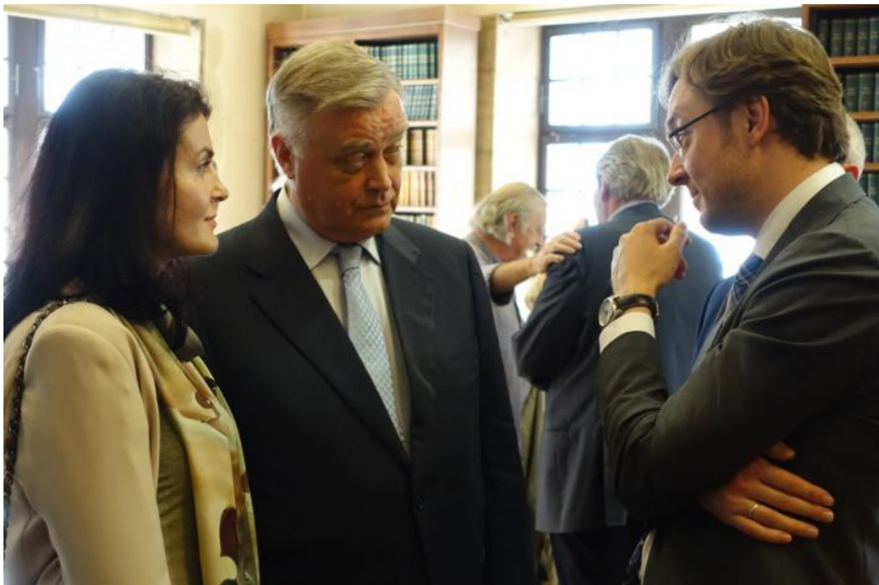
• Президент Фонда Андрея Первозванного В.И. Якунин со своими сотрудниками