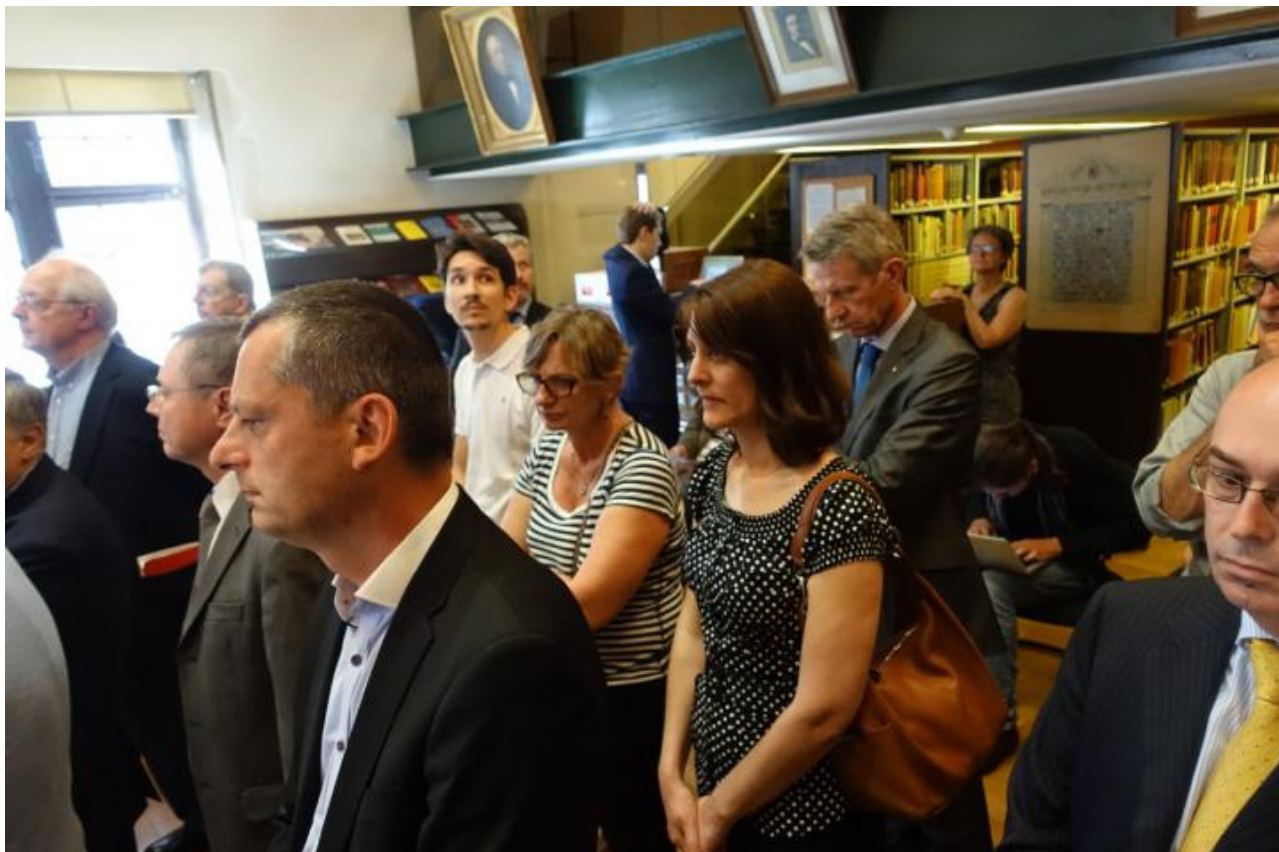
Разноязыкая и разновозрастная публика на вернисаже