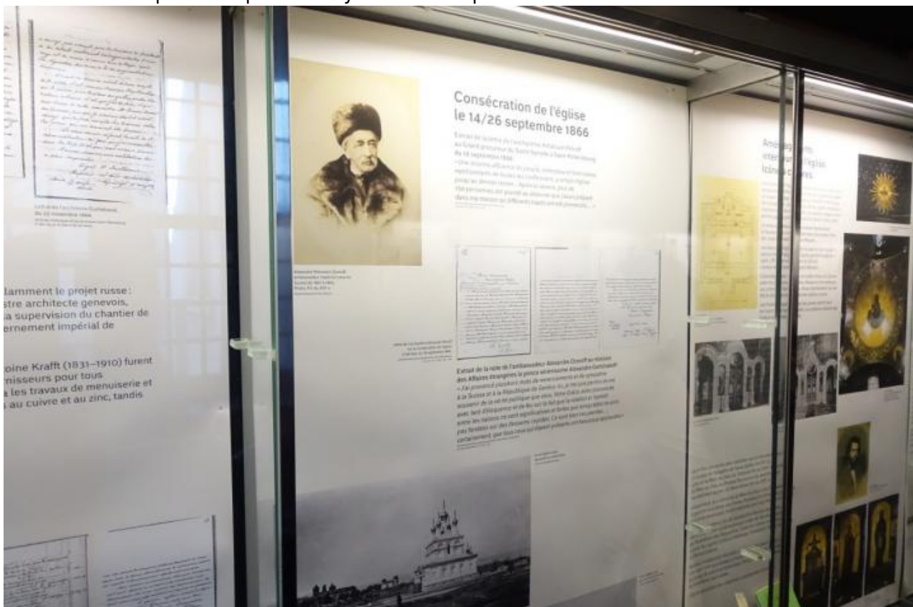
Один из выставочных стендов