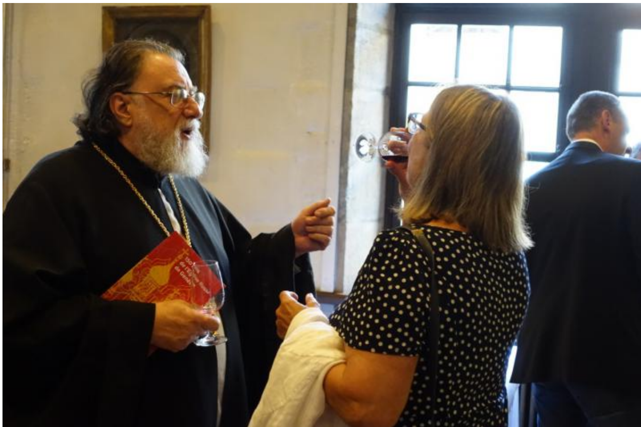
Фуршет - обязательная составляющая любого вернисажа