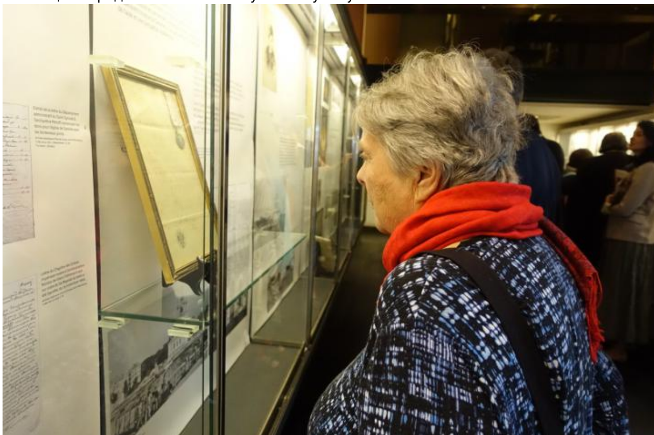
Самостоятельно знакомится с выставкой Т.Ф. Фаберже