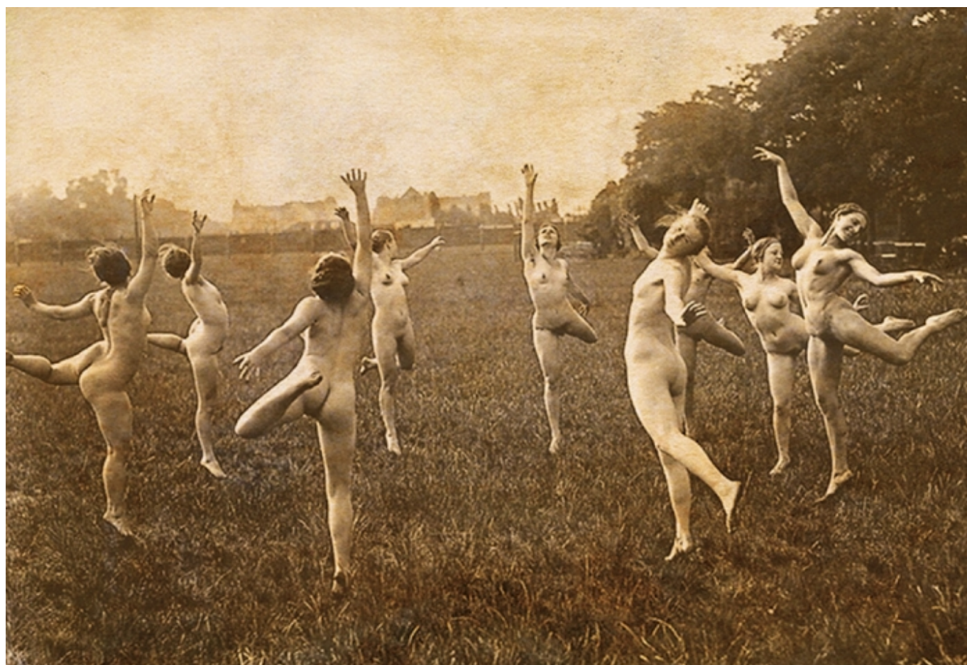
Неизвестный автор. "Танец".

Автор: Надежда Сикорская, Женева, 15. 04. 2016.