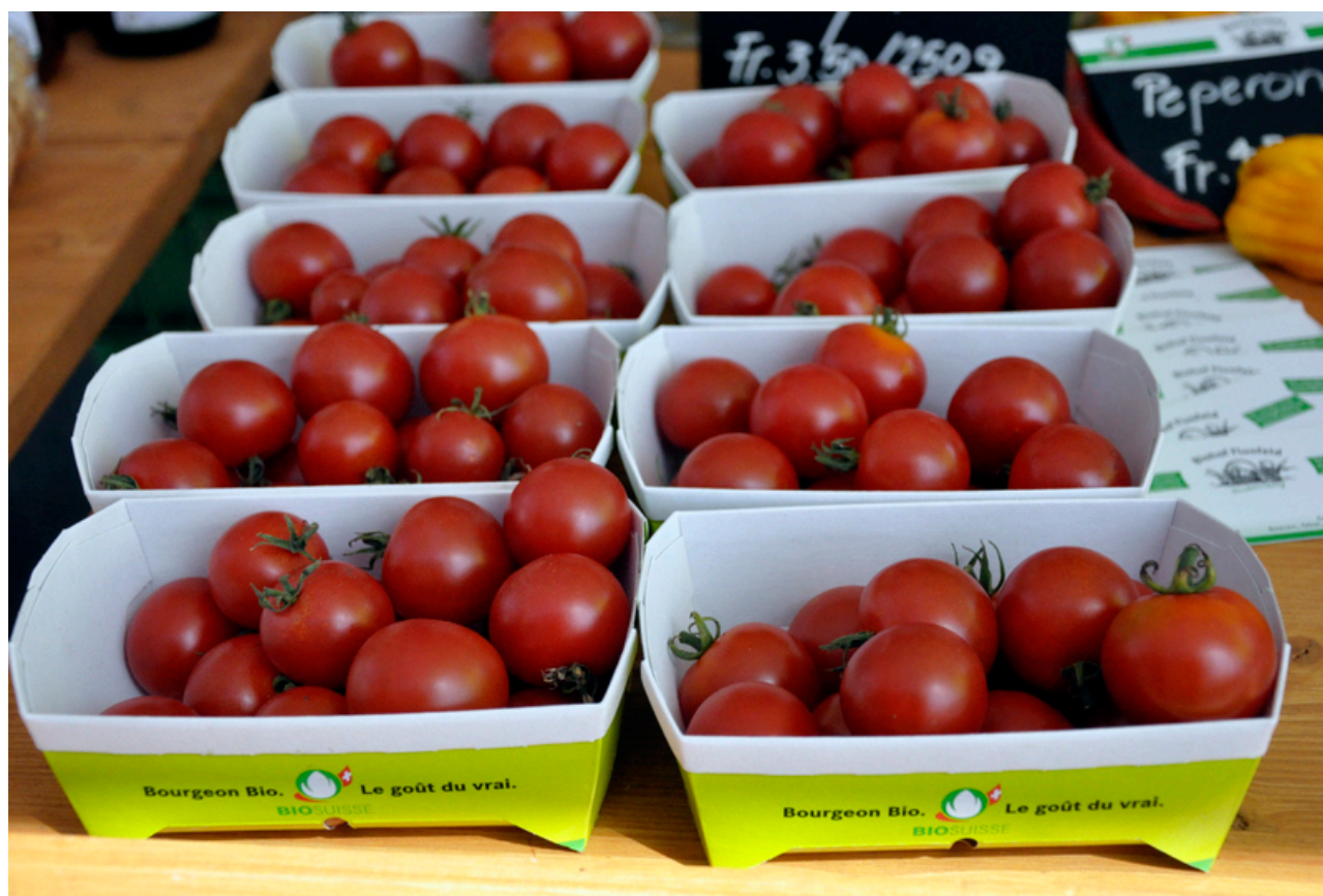
Овощи - на третьем месте по популярности в категории "био"

превысило 6 тысяч. Следует отметить, что требования, которые Федерация предъявляет к поставщикам, строже норм, установленных законодательством, а около 80% продуктов «с почкой» имеют швейцарское происхождение.