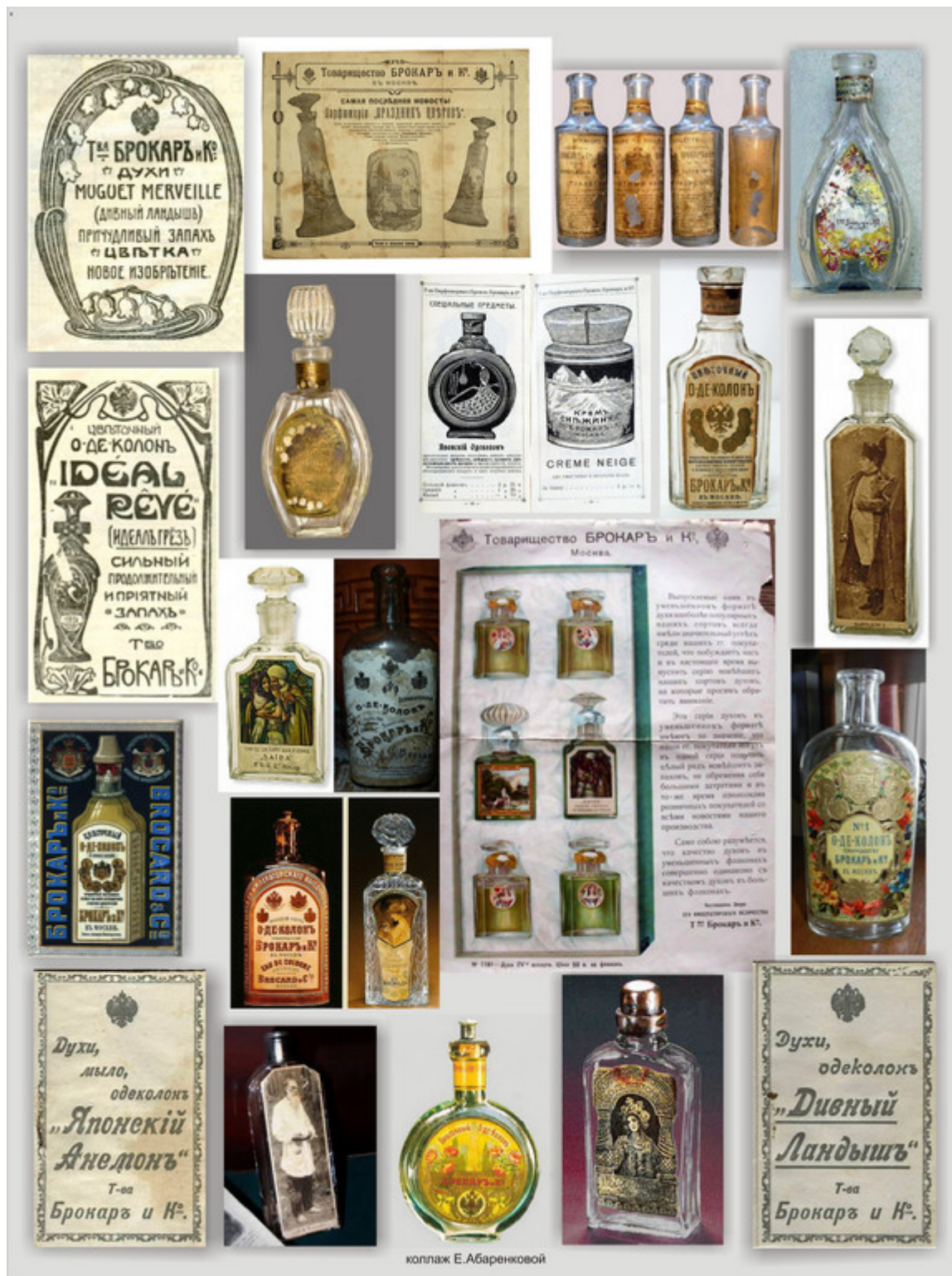
коллаж Е. Абаренковой

Со временем фабрика Брокара стала одним из самых благополучных предприятий города. Известно, что за всю историю ее существования на ней почти не было забастовок. Кроме хорошей зарплаты, в качестве премии каждому сотруднику фабрики выдавались мыло, духи и одеколоны, пропорционально количеству членов семьи. Если же работник изъявлял желание приобрести продукцию другой фирмы, то хозяин оплачивал часть ее стоимости.