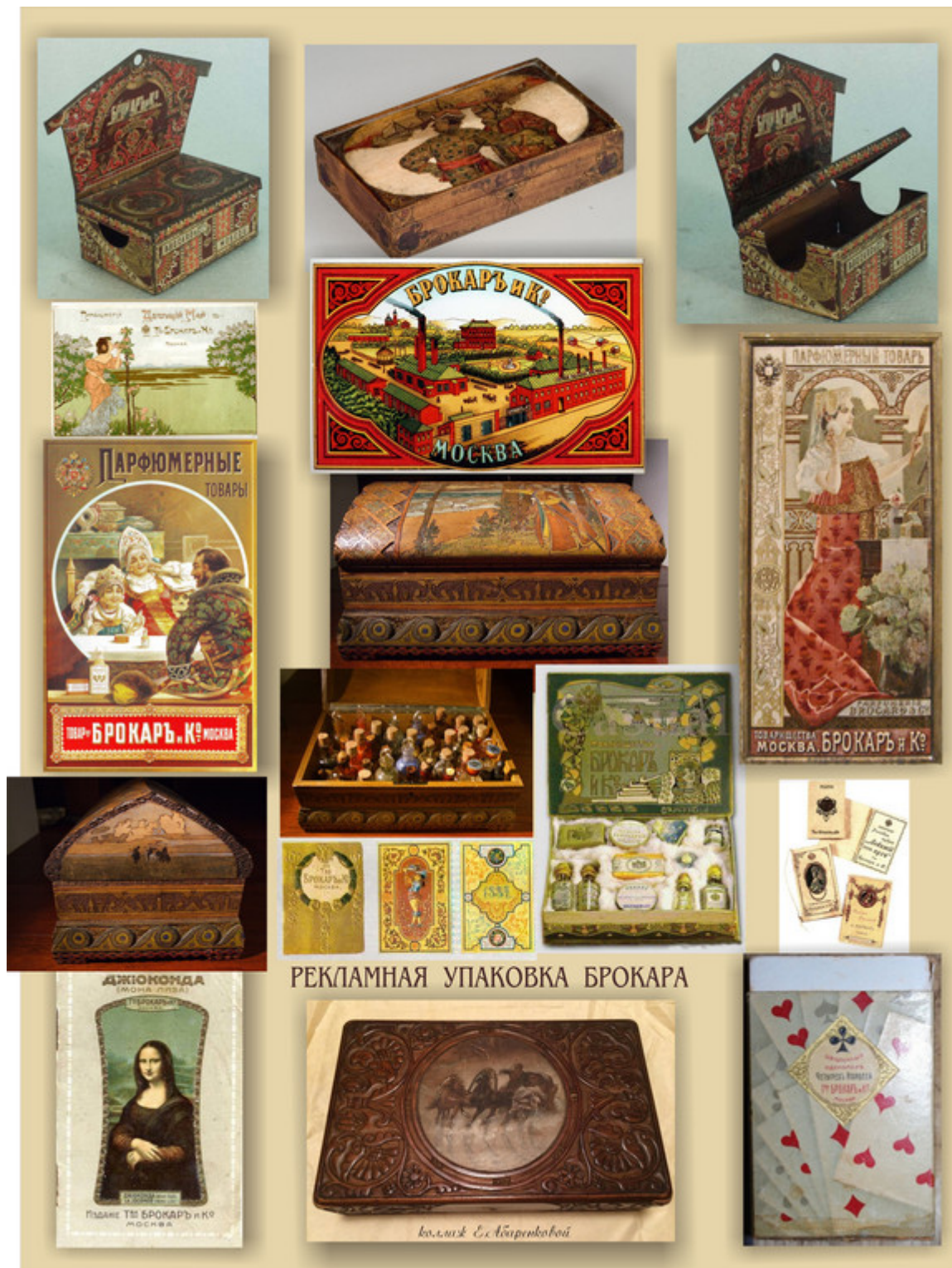
РЕКЛАМНАЯ УПАКОВКА БРОКАРА

Первым шагом стал выпуск собственного одеколона, появление которого он обставил необычным образом. В 1882 году, на Всероссийской промышленно-художественной выставке в Москве, струями одеколona «Цветочный» бил... настоящий фонтан. Никто не мог пройти мимо: дамы окунали в струи фонтана свои шляпки, а мужчины — фалды пиджаков. Подобного не устраивал еще никто. Успех московского парфюмера был полный и бесповоротный, но убедить русских дам покупать выпущенные в Москве духи все равно не удавалось. Ни самые современные технологии, ни то, что владелец фабрики был осведомлен обо всех последних европейских новшествах, которые немедленно внедрял в производство, не помогали. Доверяли не брокаровским, а «настоящим», французским духам только «из самого Парижа».