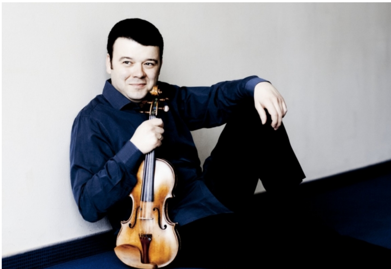
Вадим Глузман

Автор: Надежда Сикорская, Женева-Лозанна, 14. 03. 2016.