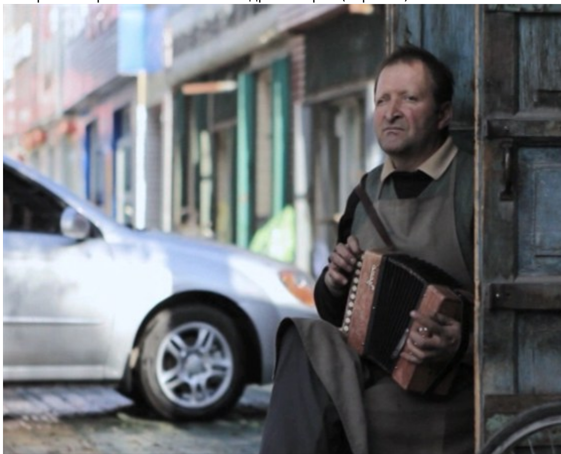
"Кадриль над Тянь-Шанем" (Россия, 2012)