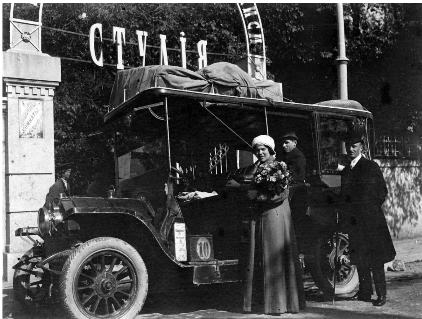
"Букет для Плевицкой" (Россия, 2014)

Кинофестиваль продлится неделю: кому достанется главный приз фестиваля, бронзовый «Философский пароход», будет объявлено 14 ноября на торжественной церемонии награждения.