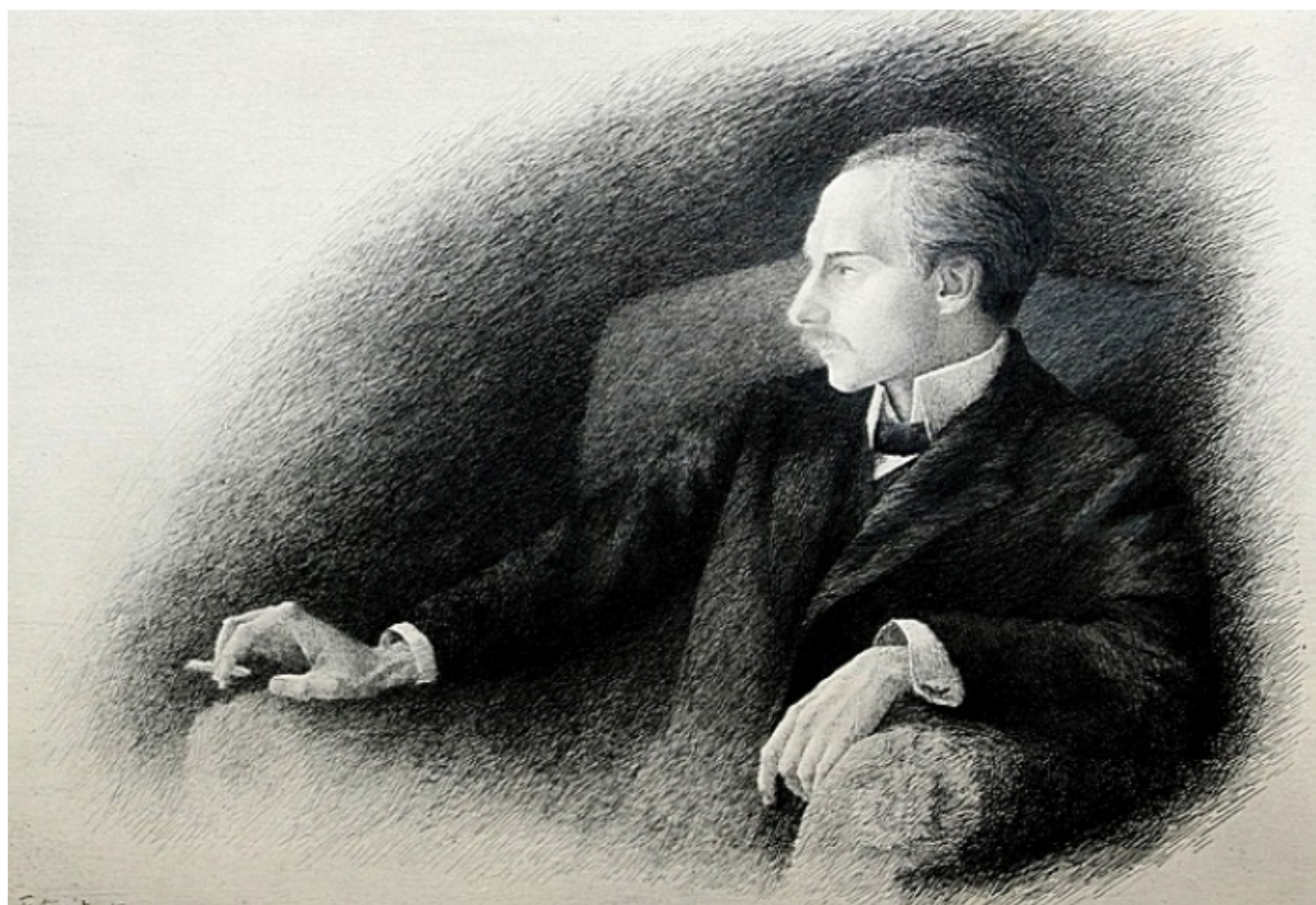
А.А. Тургенева. Портрет Андрея Белого. Офорт. 1909 г.

Автор: Надежда Сикорская, Москва-Женева, 26. 10. 2015.