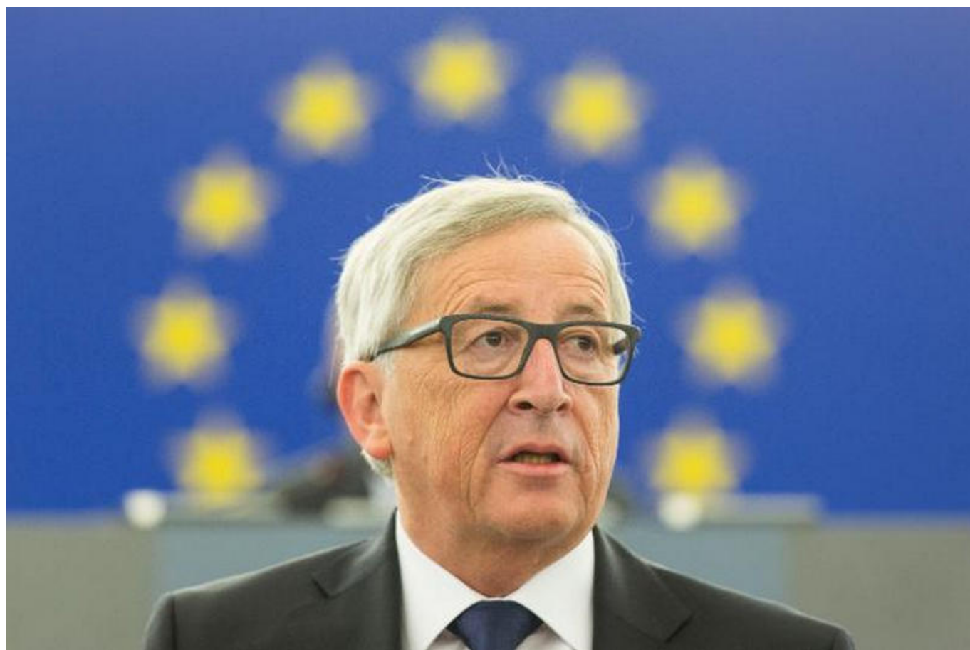
Жан-Клод Юнкер

Согласно предложенному механизму, который получил поддержку Европарламента, квоты на прием просителей приюта будут определяться в соответствии с численностью населения страны, размером ее ВВП, уровнем безработицы и числом беженцев, принятых в течение последних четырех лет. Страна, которая не сможет стать частью этого механизма «по уважительным и объективным причинам, таким как природная катастрофа», должна будет внести свой вклад в программу финансирования в размере 0,002% своего ВВП.