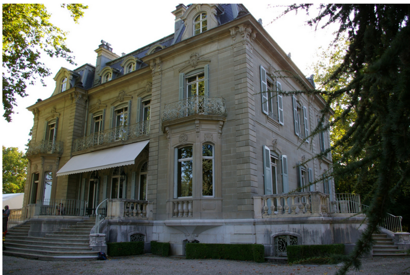
Вилла Fleur d'Eau

«В этом году, по случаю празднования 70-летия создания Организации Объединенных Наций, Генеральный секретарь Пан Ги Мун напомнил нам всем, что «сегодняшние вызовы выходят за пределы границ, а их решение требует комплексного подхода, который может быть достигнут путем переговоров и компромисса». Два человека, рукопожатию которых мы отдаем дань сегодня, знали об этом лучше, чем кто-либо другой», – сказала в своей речи Постоянный представитель США при отделении ООН и других международных организациях в Женеве Памела Хамамото.