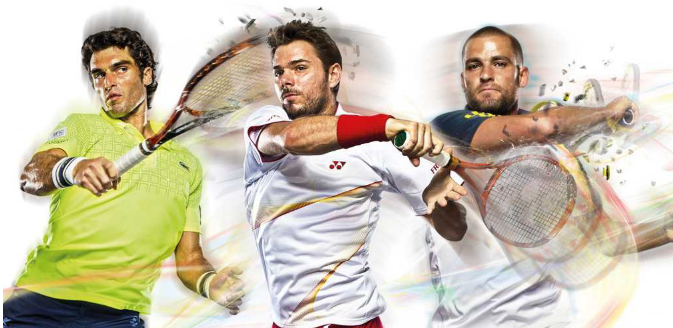
Победитель-2014 Пабло Андухар Альба, надежда-2015 Стэн Вавринка и победитель-2013 Михаил Южный

В 1998 году в Гштааде провел свой первый «взрослый» турнир только выигравший юниорский Уимблдон Роджер Федерер. Уступив аргентинскому теннисисту Лукасу Арнольду Керу в двух сетах 4-6, 4-6, уроженец Базеля отнесся к поражению философски и не ошибся: первый Swiss Open Gstaad стал далеко не последним в его карьере. В 2004 году Федереру, обыгравшему в финале россиянина Игоря Андреева, покорился и этот титул.