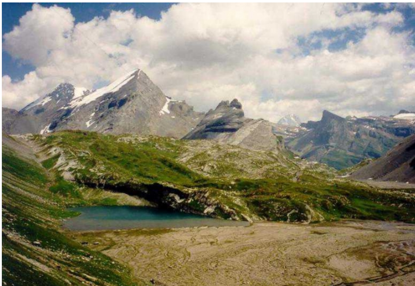
Озеро Леммернзее ( bilan.ch )

Автор: Лейла Бабаева, protopopovs, 3. 07. 2015.