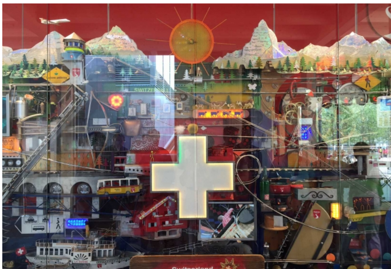
Витрина Швейцарского павильона на Экспо-2015

Автор: Надежда Сикорская, должники в швейцарии, 28. 05. 2015.