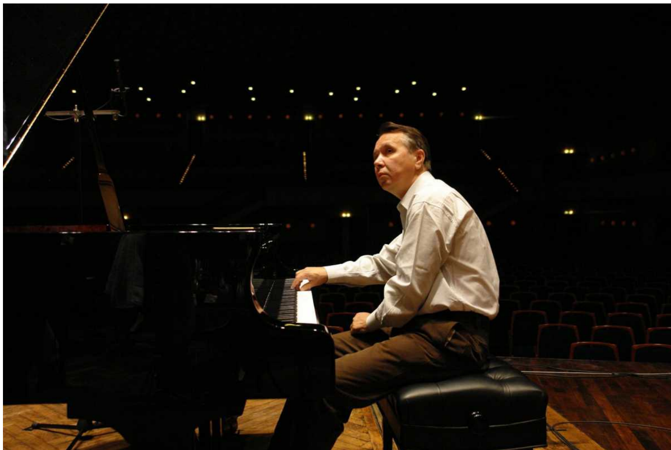
Михаил Плетнев на репетиции

К традиционным площадкам фестиваля (Аудиториум Стравинского, Театр Веве, Шильонский замок) прибавится в этом году Salle Del Castillo, расположенный на Рыночной площади Веве. Название этого зала, способного вместить оркестр для исполнения романтического репертуара XIX века, явно "отдает" Испанией. И это неспроста. Он был построен в 1907 году на деньги жившего в Веве испанского мецената, давшего городу 300 тысяч франков - сумму по тем временам громадную! Это зал очень любил живший неподалеку основатель Оркестра Романдской Швейцарии дирижер Эрнест Ансерме, сделавший здесь множество записей. Много лет зал простаивал без дела, но теперь он снова функционален. Правда, один недостаток остался - он недостаточно хорошо изолирован, и самый романтический момент может нарушить рев проезжающего по улице мотоцикла.