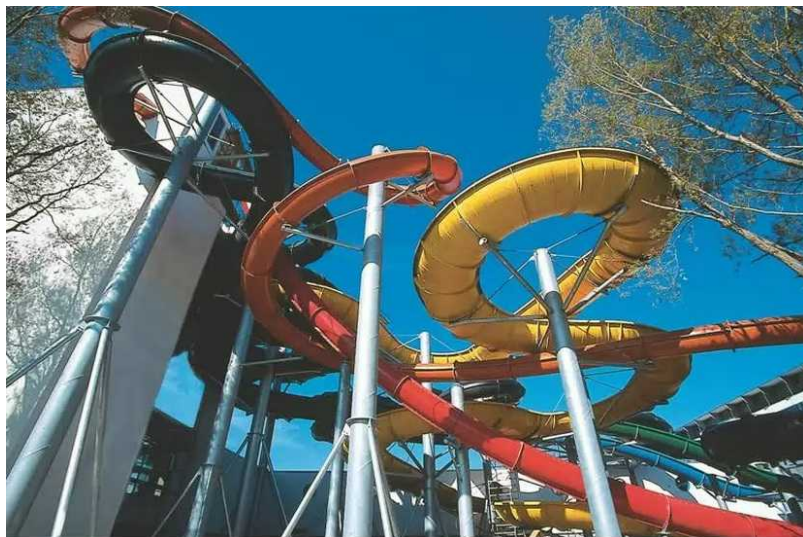
Аквапарк в Бувре ( aquaparc.ch )

В кантоне Во есть коммуна Лаве-ле-Бен, где расположены самые горячие термальные источники Швейцарии. Вода температурой 69 градусов, поднимающаяся по трубам с глубины 600 метров, обладает полезными свойствами для лечения ревматизма, проблемной кожи и двигательного аппарата. В заведении « Бани Лаве » (Route des Bains, 48) вам предложат посетить хаммам с ароматизированным воздухом (что полезно для дыхания и помогает расслабиться), джакузи, гидромассаж, светотерапию и много других удовольствий.