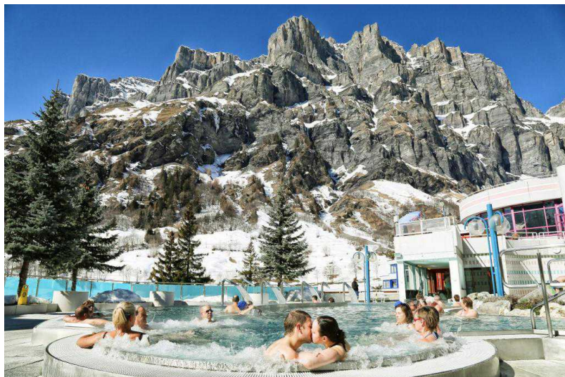
Купание в термальной воде в Лойкербаде

В Моршах (кантон Швиц) по адресу Dorfstrasse 10 расположен отель Swiss Holiday Park , в котором, кроме гидромассажа, детских бассейнов и стометровой водной горки, к услугам клиентов – романо-ирландские бани, джакузи с соленой водой, сауна, укрепляющие ванны, массаж, фитнес-центр и салон красоты. Отель примечателен тем, что в нем предусмотрены многочисленные удобства для семей с детьми, включая игровые площадки, большую детскую зону и «скалы» в бассейне, минигольф, детскую школу картинга, празднование детских дней рождения, детские меню, и несколько детских площадок на свежем воздухе.