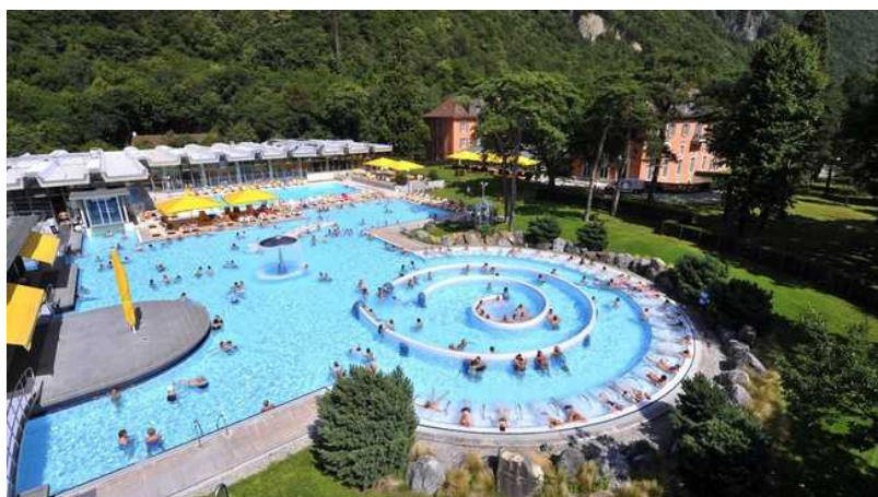
В бассейнах Лаве-ле-Бен места много

Если вас тянет в Тичино, то в коммуне Ривера-Монтеченери (via Campagnole, 1) можно посетить аквапарк Splash e Spa Tamaro . Спуск в огромной трубе на четырехместной надувной «ромашке» в сопровождении звуковых и световых эффектов, с вылетом в бассейн сквозь водопад в конце, спуск по темному туннелю, в который вносят разнообразие вспышки «огня» и молнии, спуск по туннелю, черному, как деготь, или же по туннелю, изогнутому, как раненая змея, после которого вы вылетите в бассейн, едва переводя дыхание.