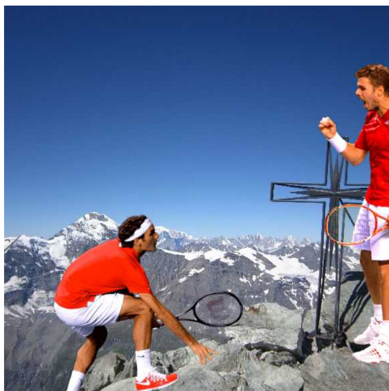
Стэн и Роджер по версии аудитории RTS

Получасовая тренировка, которую Федерер провел в среду вечером на арене Пьер Моруа в Лилле, и последовавшая за ней в четверг утром еще одна, вместе со Стэном Вавринкой, вселяли надежду. «Внезапно ... явление!», – так французская газета L'Equipe охарактеризовала чувство, которое испытали свидетели первого после травмы появления на корте обладателя многочисленных рекордов. Любители тенниса не теряли надежду, что сегодняшняя встреча с французом Гаэлем Монфисом состоится. «Финал без Федерера – все равно, что выступление Rolling Stones без Мика Джаггера», – признался накануне спортивный обозреватель L'Equipe швейцарской газете Berner Zeitung.