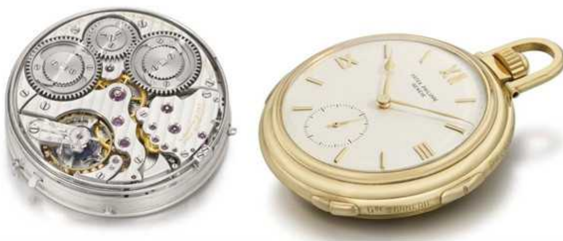
Механизм часов с боем начала 19 в.

Роскошно изданная и прекрасно иллюстрированная редкими и оригинальными фотографиями 90-страничная книга сопровождается специальной аудиосистемой, позволяющей слышать перезвон уникальных часов, отбивающих часы, четверти часов и минуты. Заказывайте скорее, и под елку!