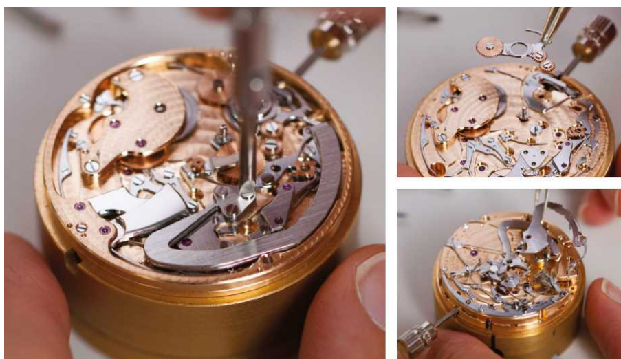
Наручные часы с Grand Sonnerie

Одной из важных вех на этом пути можно считать и увидевшую недавно свет книгу, прослеживающую историю часов с боем на протяжении веков, а также развитие этого сложнейшего механизма непосредственно брендом F.P. Journe, обладающим уже десятком запатентованных достижений в этой области и выпускающим четыре экземпляра подобных часов в год.