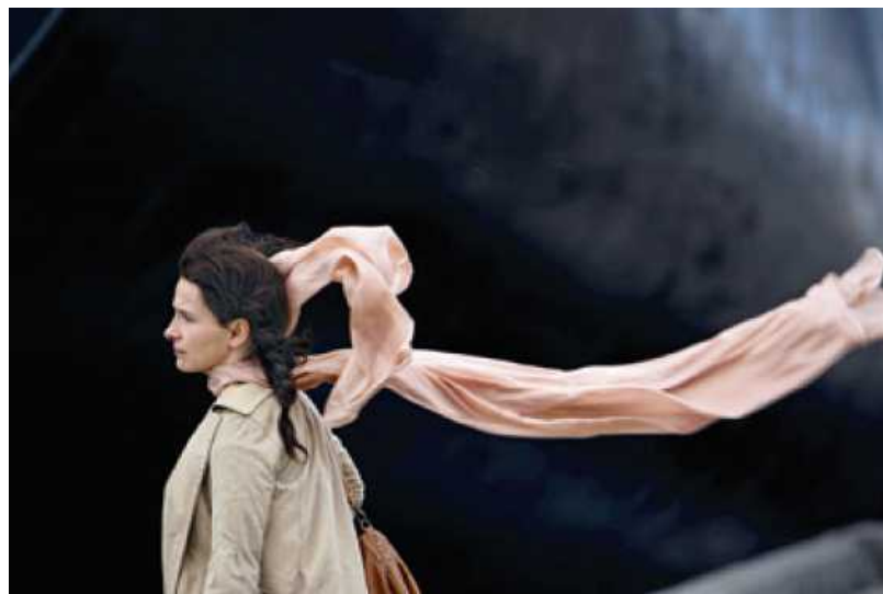
Жюльет Бинош в фильме Амоса Гитая «Размежевание»

В период между двумя мировыми войнами в творчестве «немого» комедианта произошла эволюция. Чаплина волновал взлет фашизма, обострялась его политическая сознательность, рос интерес к экономическим вопросам. Эти изменения отразились в творчестве с выходом картины «Великий диктатор», которую Чаплин снял в 1939-1940 годах. Узнав, что Гитлер посмотрел этот фильм, режиссер признался, что отдал бы все, только бы узнать, что настоящий диктатор думает о его картине. Последняя примечательна не только тем, что в ней чувствуется мастерство ее создателя и что это – первый «говорящий» фильм постановщика и актера, который тринадцать лет сопротивлялся присутствию звука в своих киноработах, но и тем, что здесь Чаплин решился высказать вслух то, о чем многие предпочитали молчать.