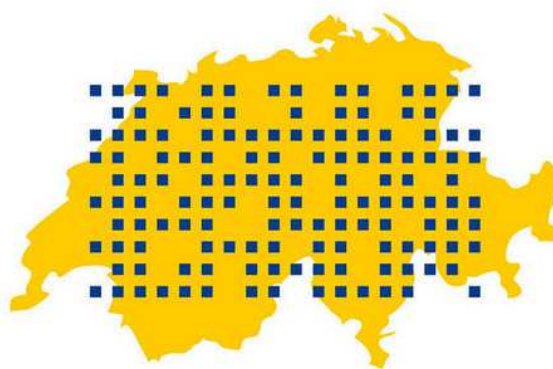
NUMBERS OF PRIVATE BANKS IN SWITZERLAND