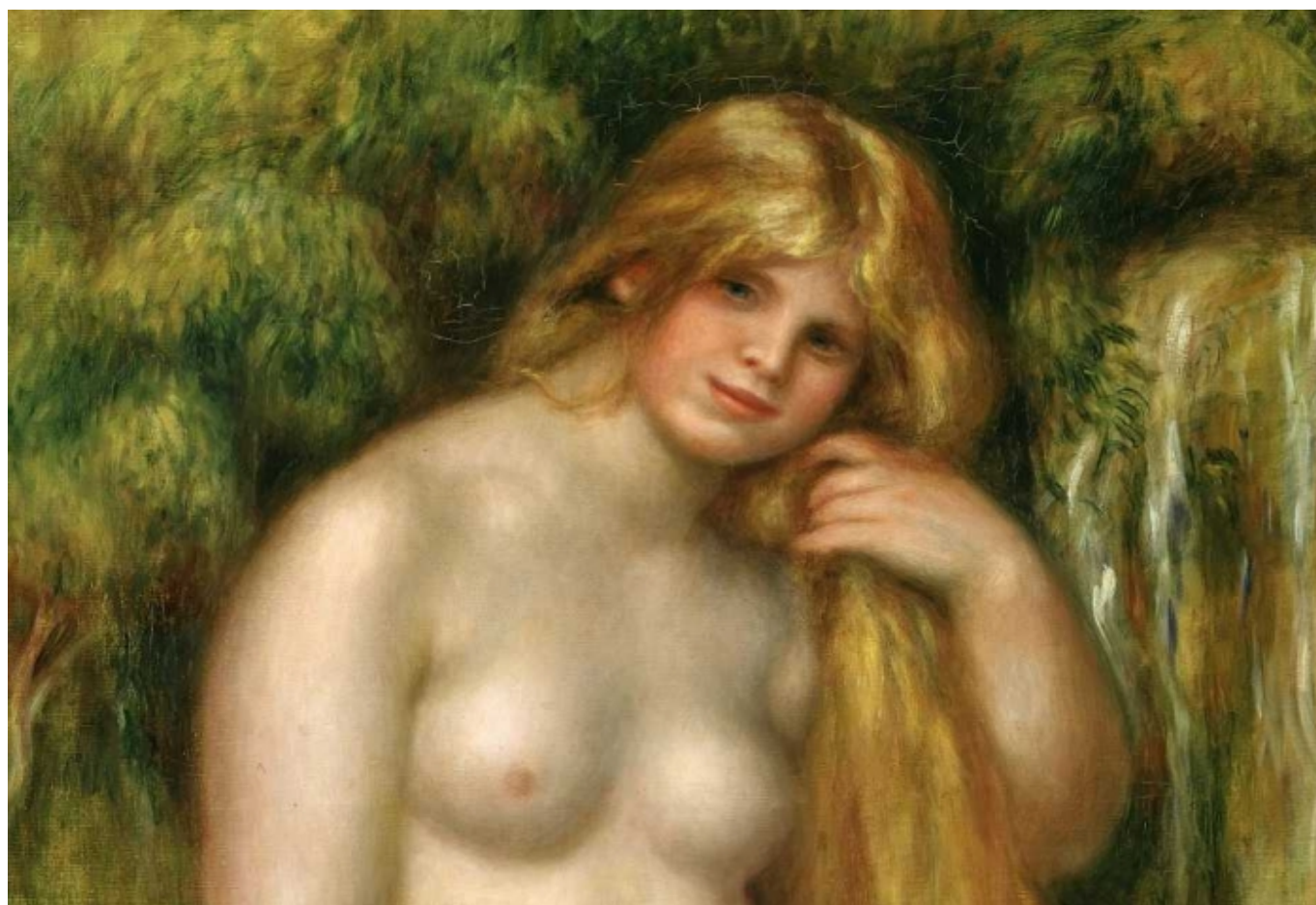
Женщина у источника. Огюст Ренуар. 1906 (Fondation Pierre Gianadda)

Автор: Азамат Рахимов, Мартиньи, 14. 07. 2014.