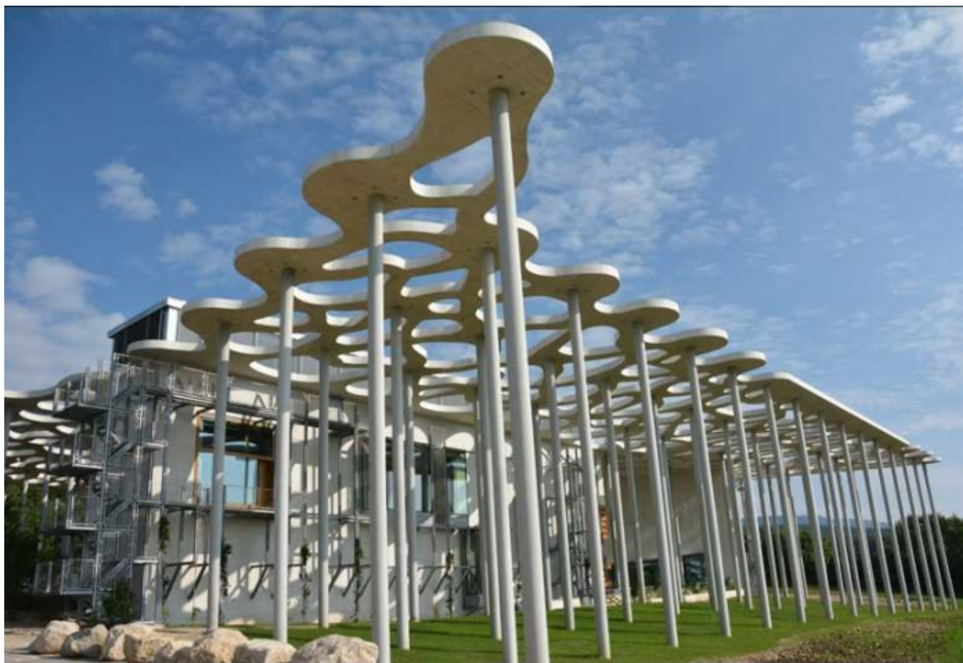
Библиотека Фонда Яна Михальски в Монрише (Léo Fabrizio)

Автор: Надежда Сикорская, Монтрише, 20. 06. 2014.