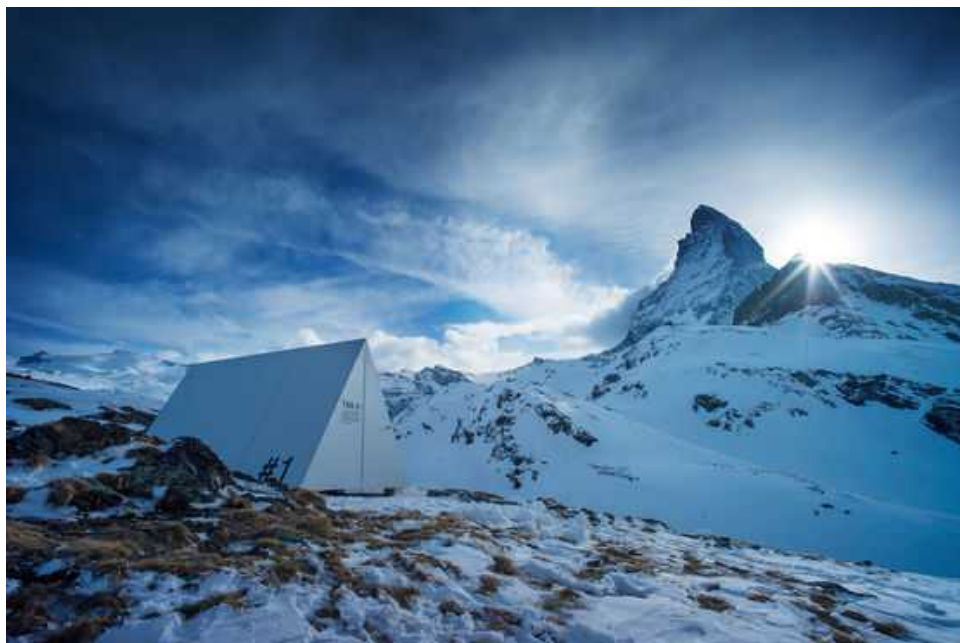
Matterhorn Base Camp

будет демонтирован и уступит место обновленной хижине Хернли, он отправится путешествовать по всему миру в качестве посланника марки Zermatt-Matterhorn.