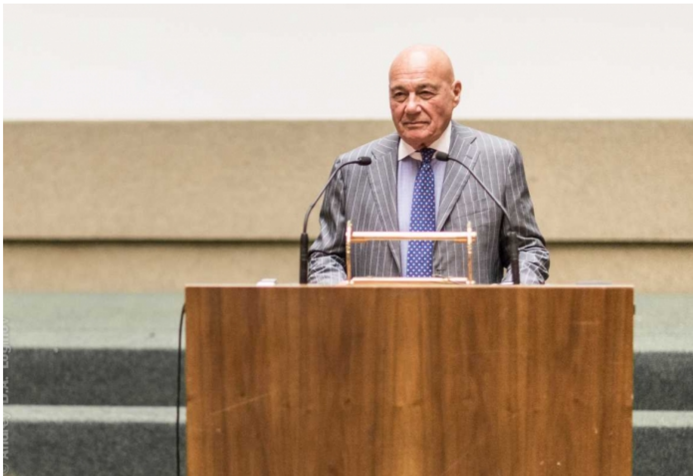
Владимир Познер в Женеве