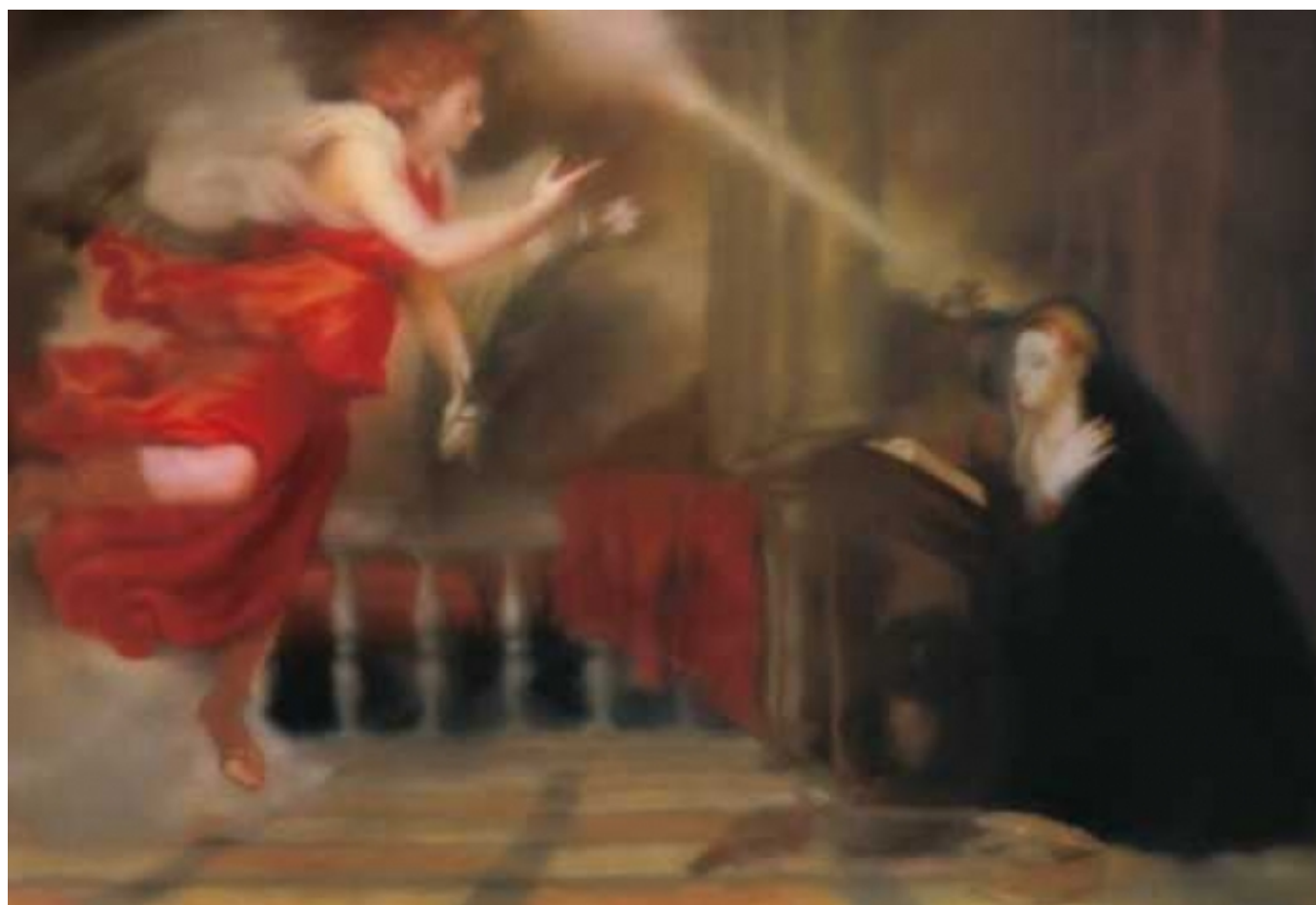
Благовещение по Тициану. Герхард Рихтер. 1973 (© Gerhard Richter)

Автор: Азамат Рахимов, Базель, 13. 06. 2014.