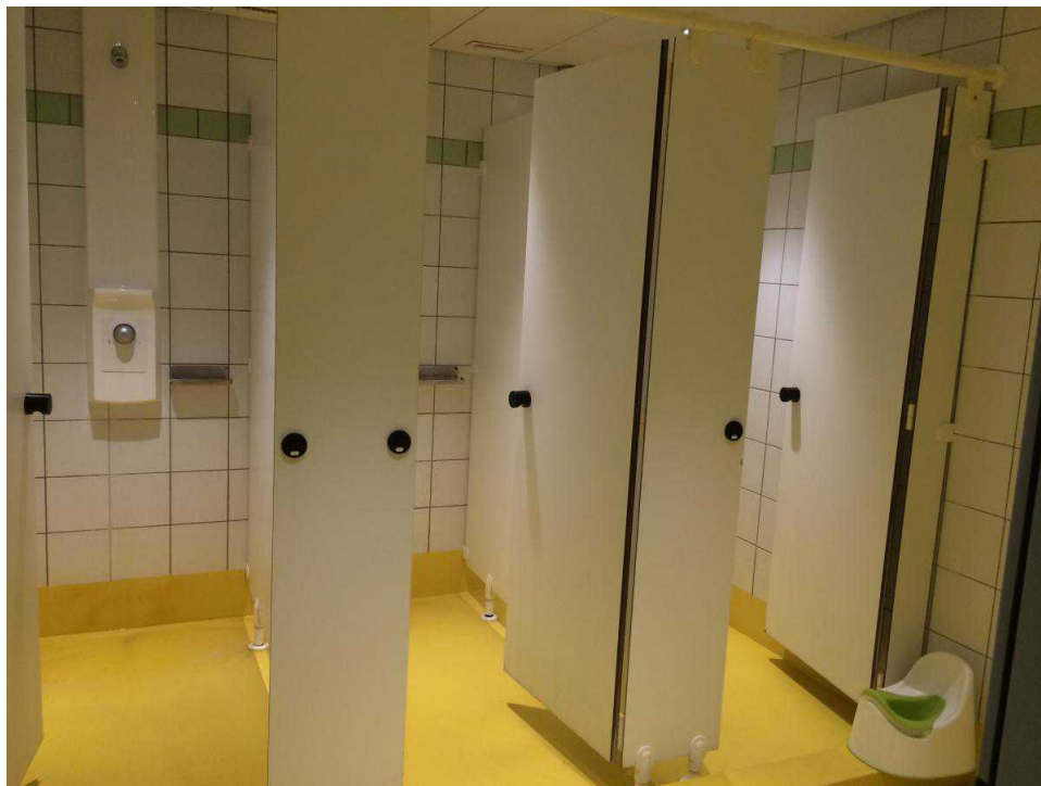
войной мест земного шара.

Так, недавно в «Нашу Газету.ch» обратилась семья из Беларуси, которая приехала в Швейцарию с 5-месячной дочерью в поисках политического убежища в 2010 году. Ответ на свое ходатайство они получили только в марте 2014 года. Согласно решению ODM, семья Д. должна была покинуть страну в течение месяца. Связавшись с ними, мы выяснили, что Д. решили попытаться счастья еще раз и по совету адвоката подали новый запрос (это дешевле, чем обращаться в суд). «Я понимаю, что существует проблема «фальшивых беженцев», которые просто придумали свои истории. Но у нас все документы в порядке, и нам опасно возвращаться обратно», – рассказал «Нашей Газете.ch» глава семьи в телефонном разговоре. В ожидании нового решения Д. живут в центре Нотхильф, условия содержания в котором далеки от тех, в которых многие мечтали бы провести лучшие годы жизни и тем более растить детей.