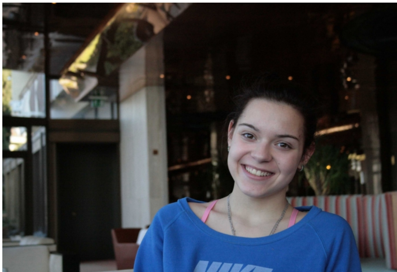
Аделина Сотникова в Монтре (Nashagazeta.ch)

Автор: Азамат Рахимов, Монтре, 7. 03. 2014.