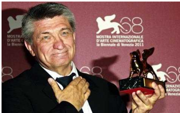
Александр Сокуров на Венецианском кинофестивале