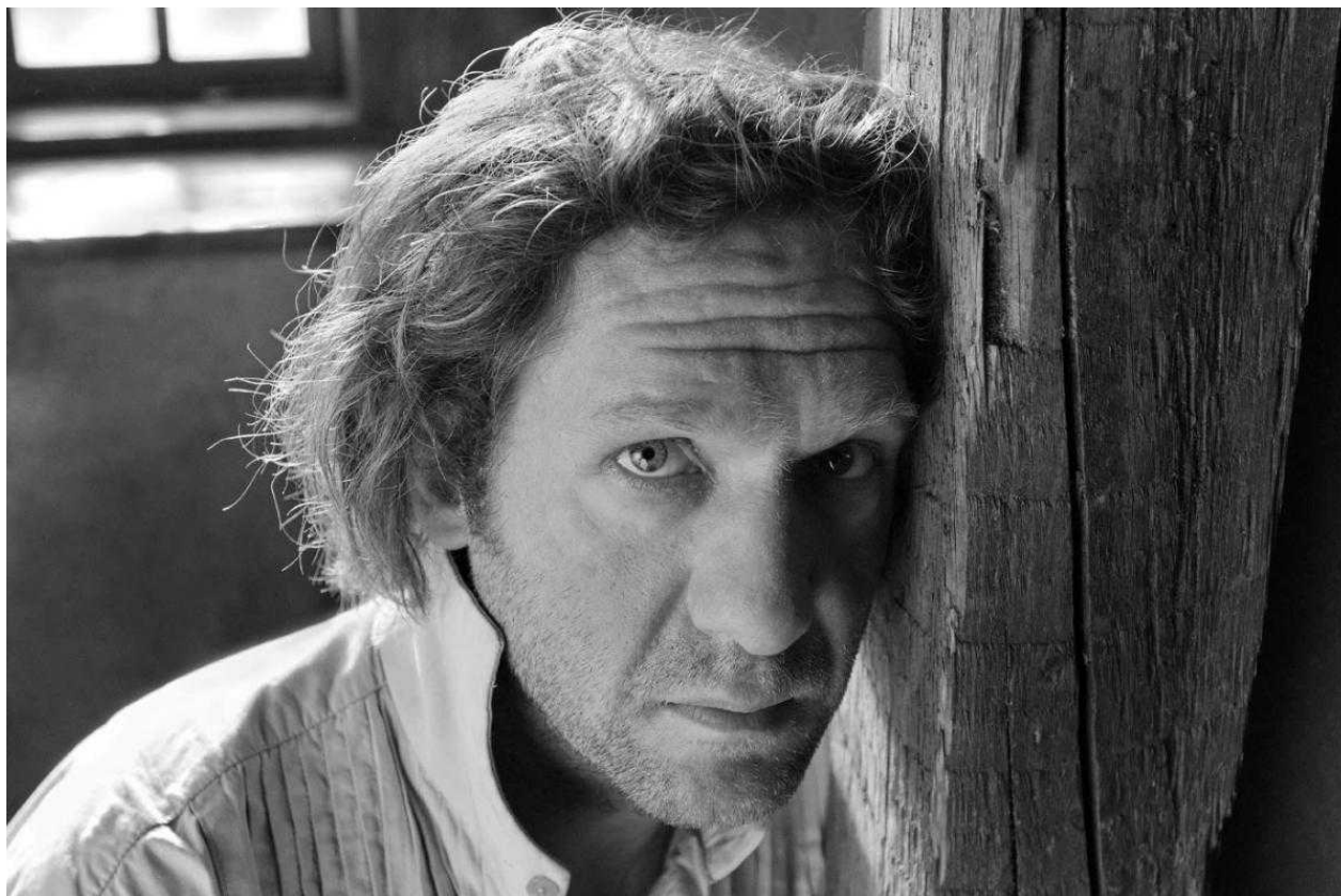
Кадр из "Фауста"

По-настоящему сильные мужские характеры могут быть в астрономии, потому что люди, которые с этим работают, понимают: перед ними несоизмеримо большая сила, чем они сами. Один раз в своей жизни я посмотрел в телескоп и дал себе слово, что больше никогда туда не посмотрю. Мне стало так страшно. Я понял, что мне это не по плечу. А рядом со мной стоял человек, который с этим справляется каждый день. При этом в нем была ирония и внутренний масштаб. Этих качеств нет у политических деятелей, у них есть только стихия воли. А у этого астронома они были. Ему я бы доверил управление государством.