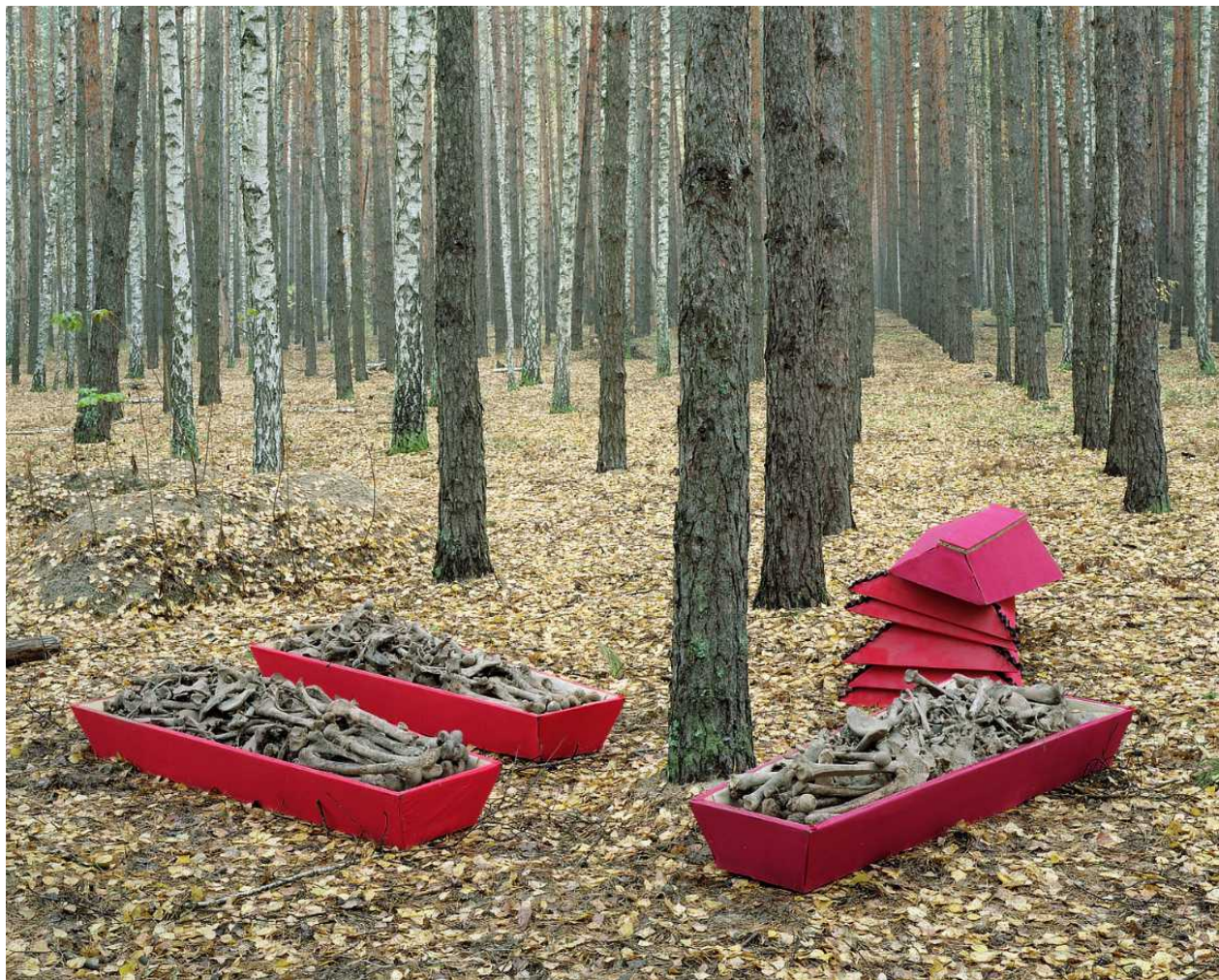
На месте массовых захоронений под Воронежем