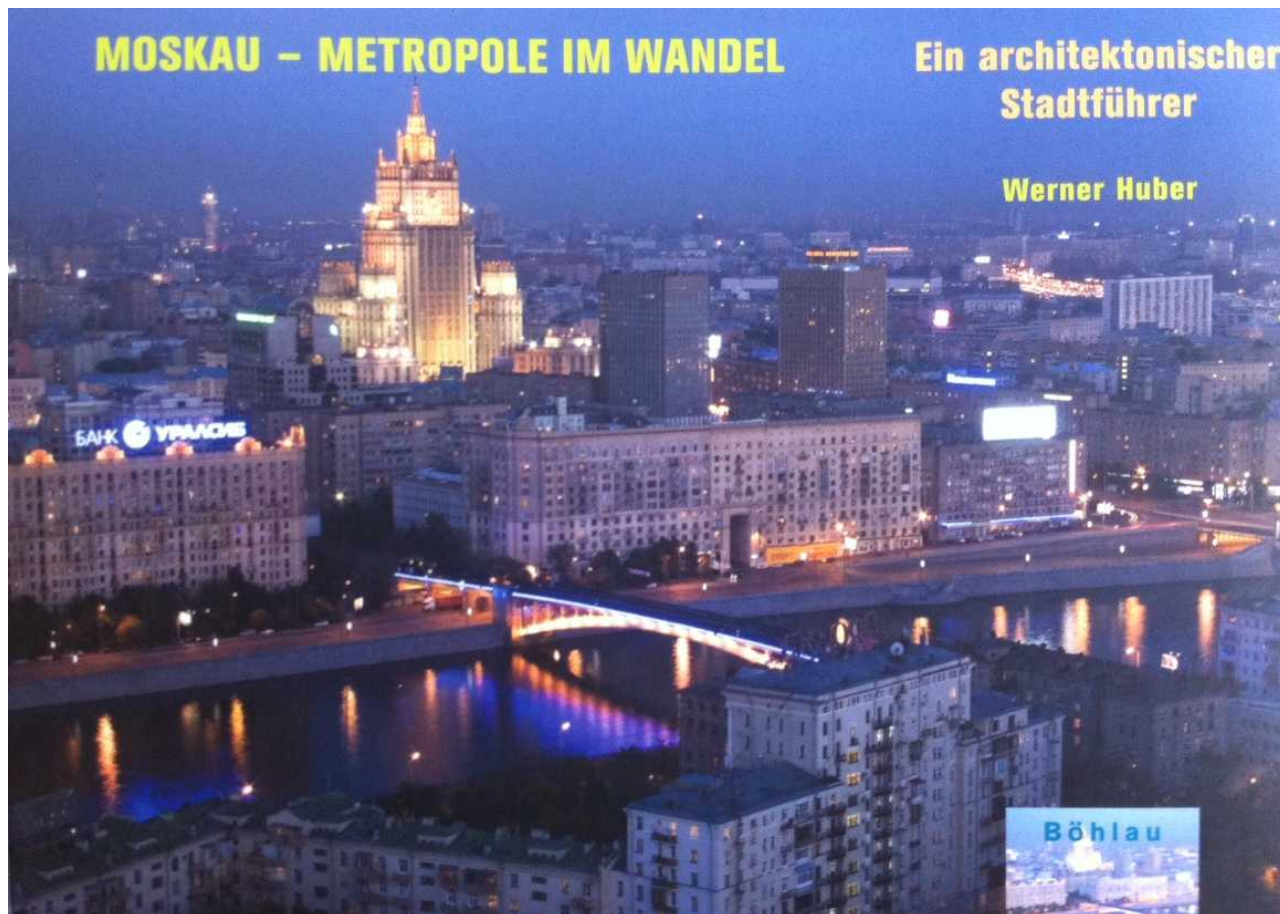
Обложка книги Хубера