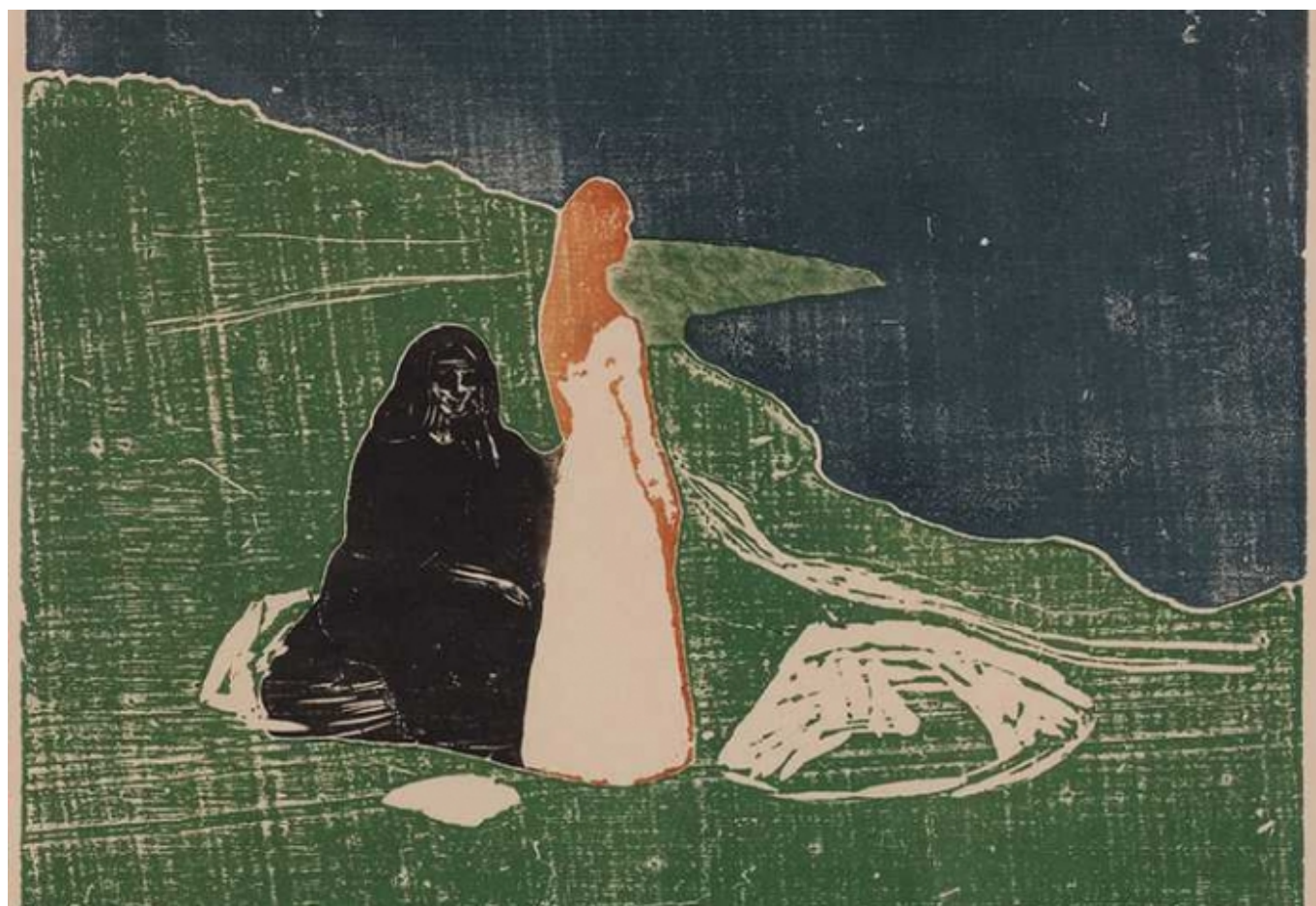
Две женщины на берегу. Эдвард Мунк. 1898 (© ProLitteris)

Автор: Азамат Рахимов, Цюрих, 8. 10. 2013.