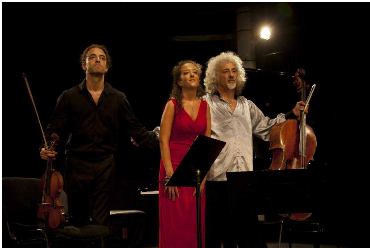
Семейный концерт Майских в Вербье (Aline Paley)