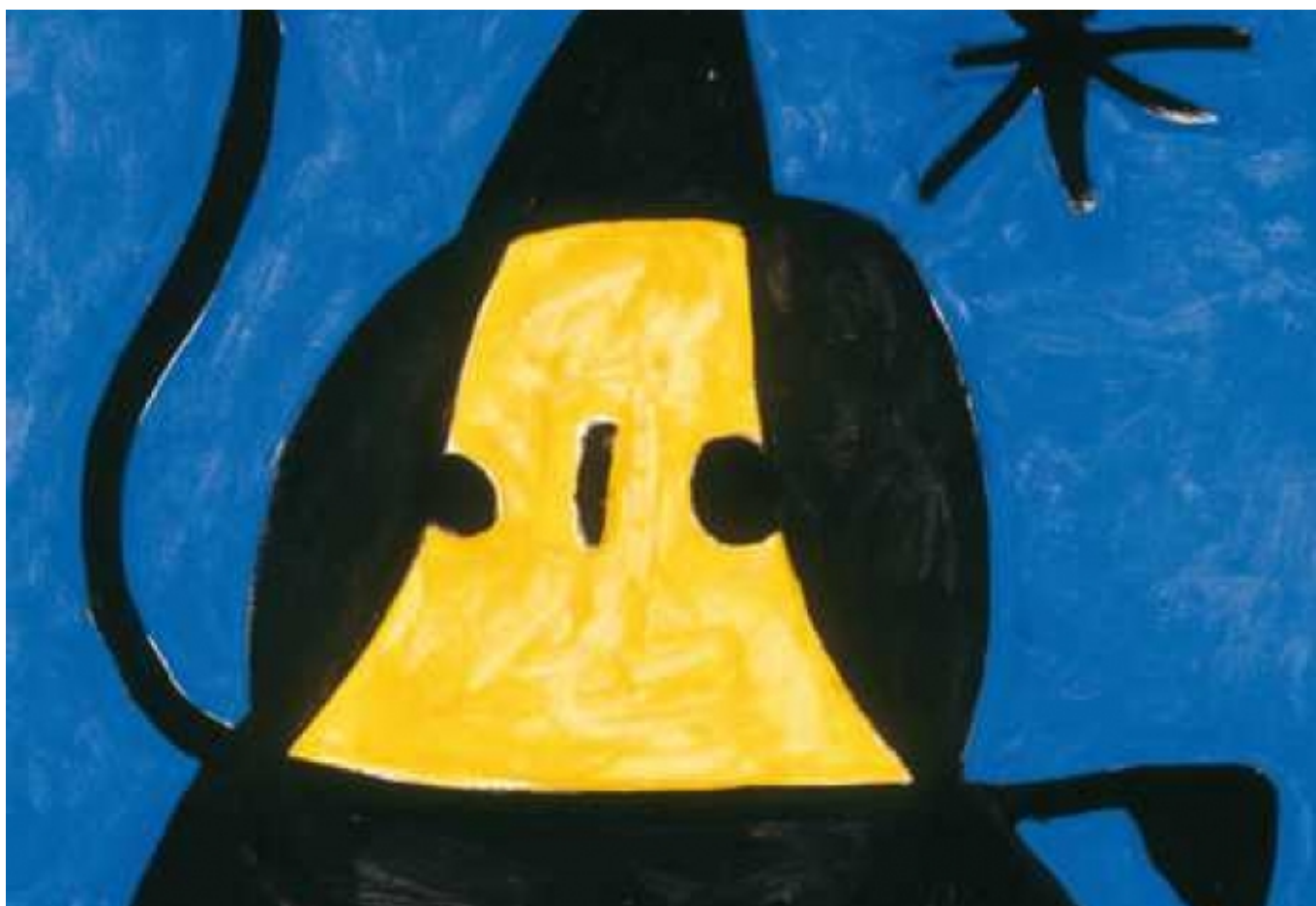
Без названия. Жоан Миро. 1978 год

Автор: Азамат Рахимов, Лозанна, 17. 07. 2013.