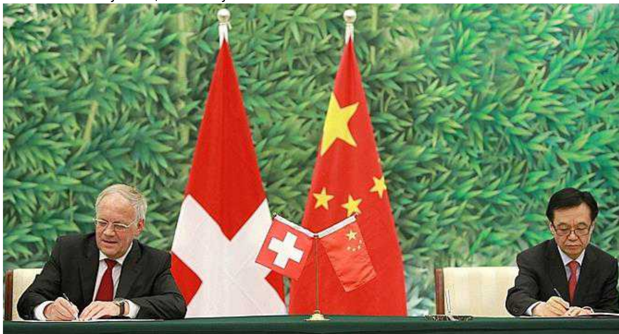
Йоханн Шнайдер-Амман и Гао Хучэн подписывают соглашение

Помимо охлаждения отношений с ЕС швейцарские парламентарии боятся, что китайцы наводнят рынок дешевыми и некачественными товарами. Чтобы избежать подобной угрозы, обсуждаются новые механизмы контроля качества. Еще один страх связан с предприимчивостью китайцев, которые готовы наладить свое производство в Швейцарии и ставить на товарах заветное клеймо «Made in Switzerland». Однако велика вероятность, что на многие подобные моменты швейцарцы закроют глаза, как только увидят объемы прибыли, стабильно поступающей в казну.