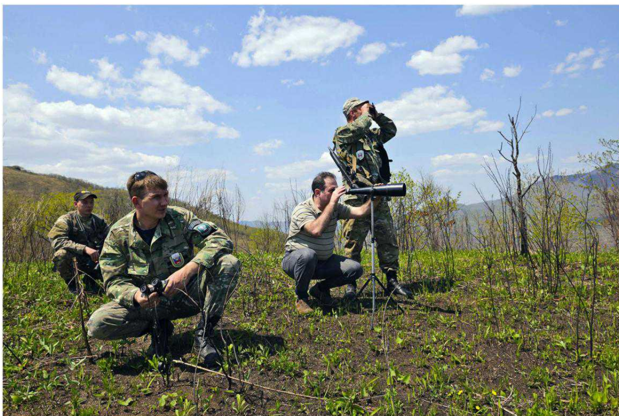
THE ROLEX AWARDS FOR ENTERPRISE, SERGEI BEREZNUK, RUSSIA, 2012 LAUREATE

Вы знаете, несмотря на экономический кризис, мы чувствуем огромную поддержку со стороны международного сообщества и продолжаем бороться за сохранение тигра и среды его обитания совместно со многими нашими международными партнерами – природоохранными организациями. Поступают деньги и от частных лиц из-за рубежа. А вот русские фирмы и состоятельные люди не проявляют большого интереса к нашей работе. Русский олигарх скорее даст миллион долларов зарубежной хоккейной команде, чем пожертвует на охрану